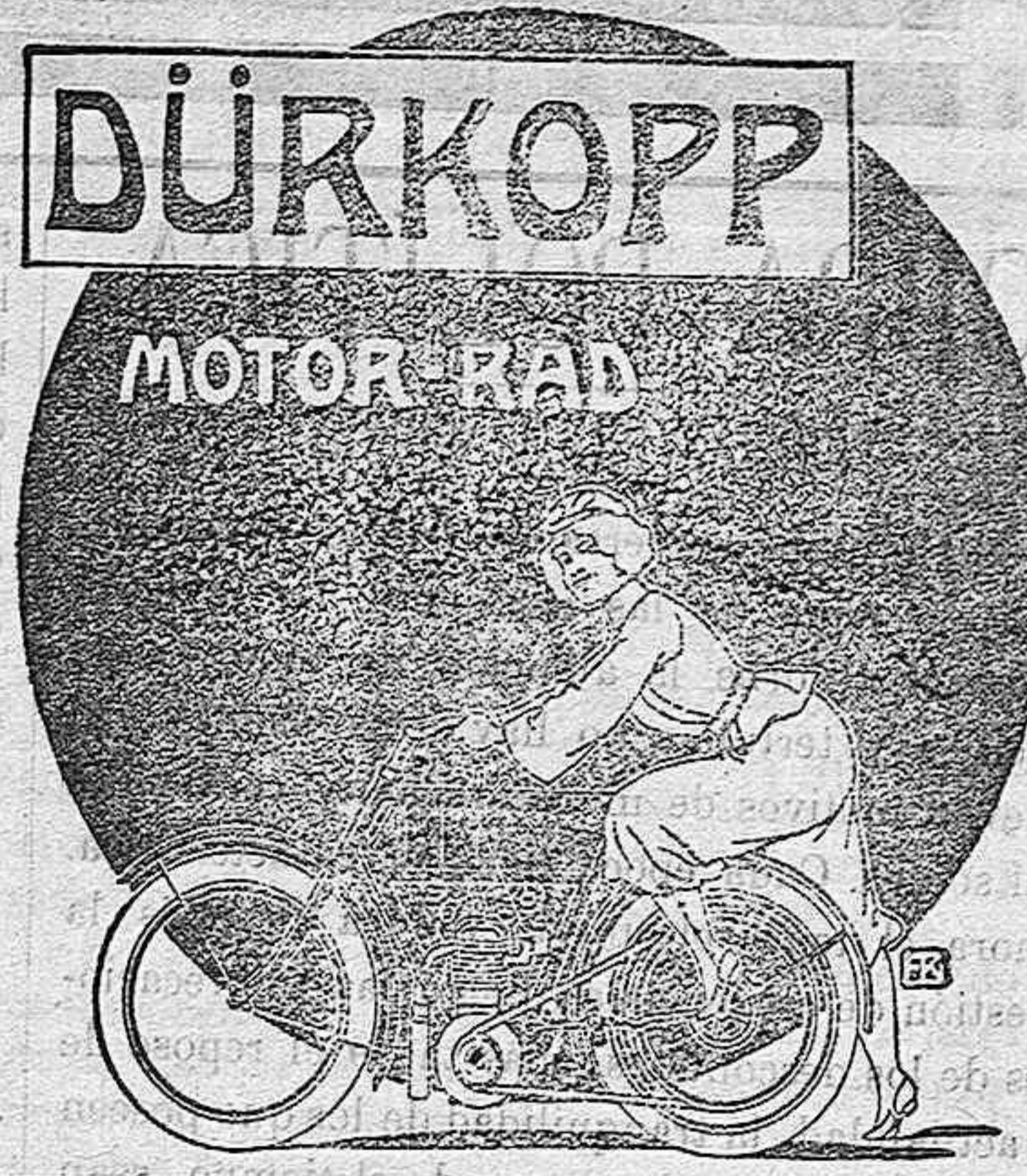
DURKOPP & C. A. G. BIELEFELD.