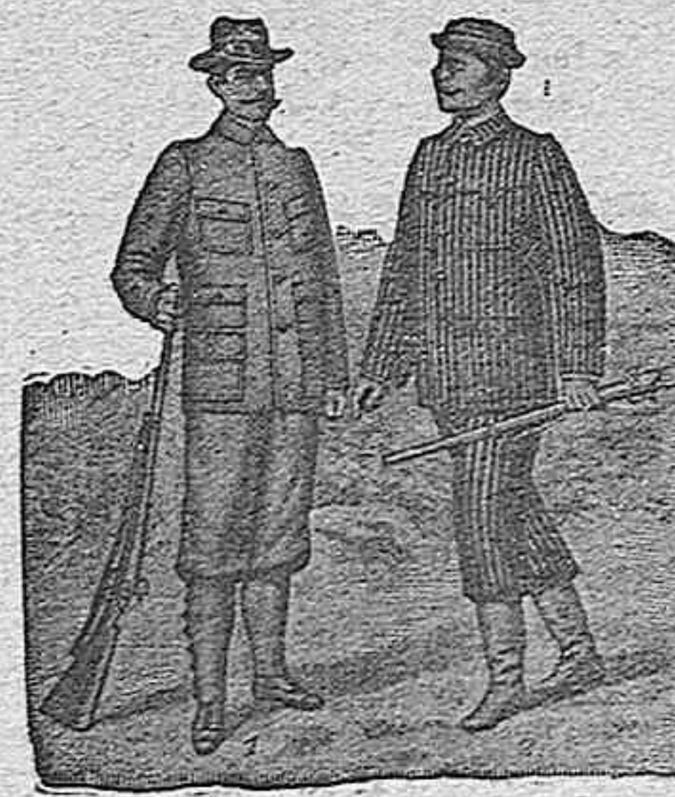
Figura 1.ª.—Traje propio para caza y viaje, en Khaki inglés pesetas... 70 En seda Japonesa. 60 En hilo Mayor-quin... 40

De nuestro Catálogo de prendas de caza, campo y sport.