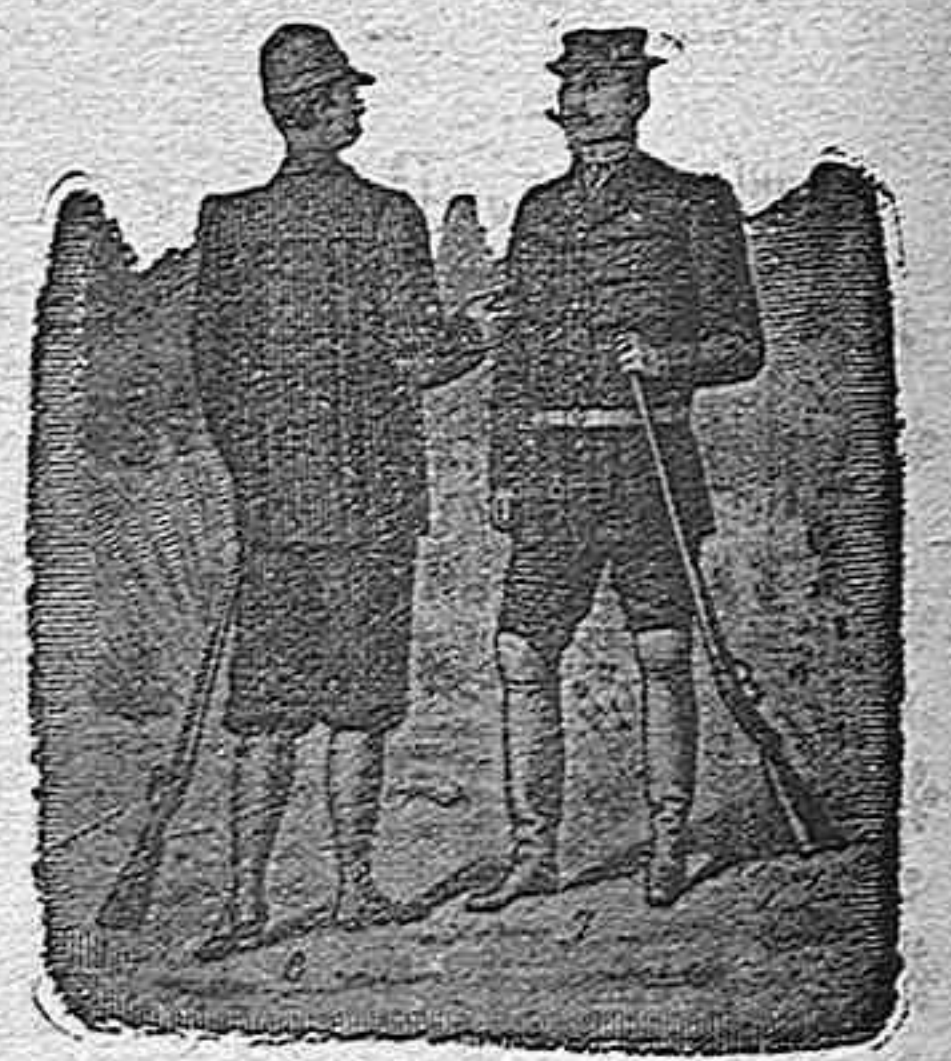
Figura 2.ª.—Traje dril rayado pesetas. 40 Americana solo, desde... 10 Pantalón... 10

De nuestro Catálogo de prendas de caza, campo y sport.