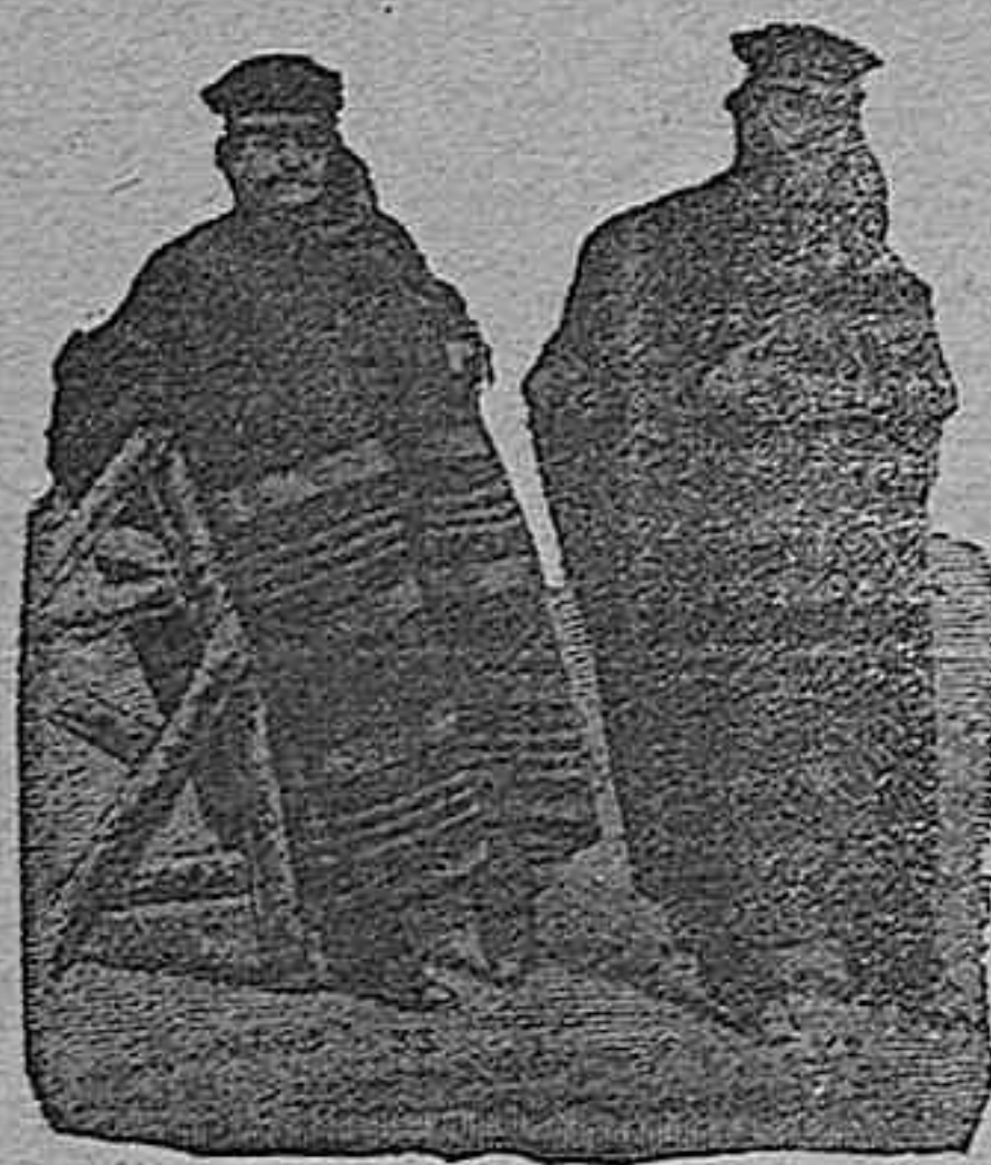
Figura núm. 30. Capote sevillano, gris oscuro, impermeabilizado, las caídas y aberturas de atrás están bordadas con paño, cuello de piel y capucha, 90 pesetas.—Figura núm. 31. Capote abulense, gris y blanco, impermeabilizado, cuello de piel, capucha caoutchouc, 60 pesetas.

De nuestro Catálogo de prendas de caza, campo y sport.