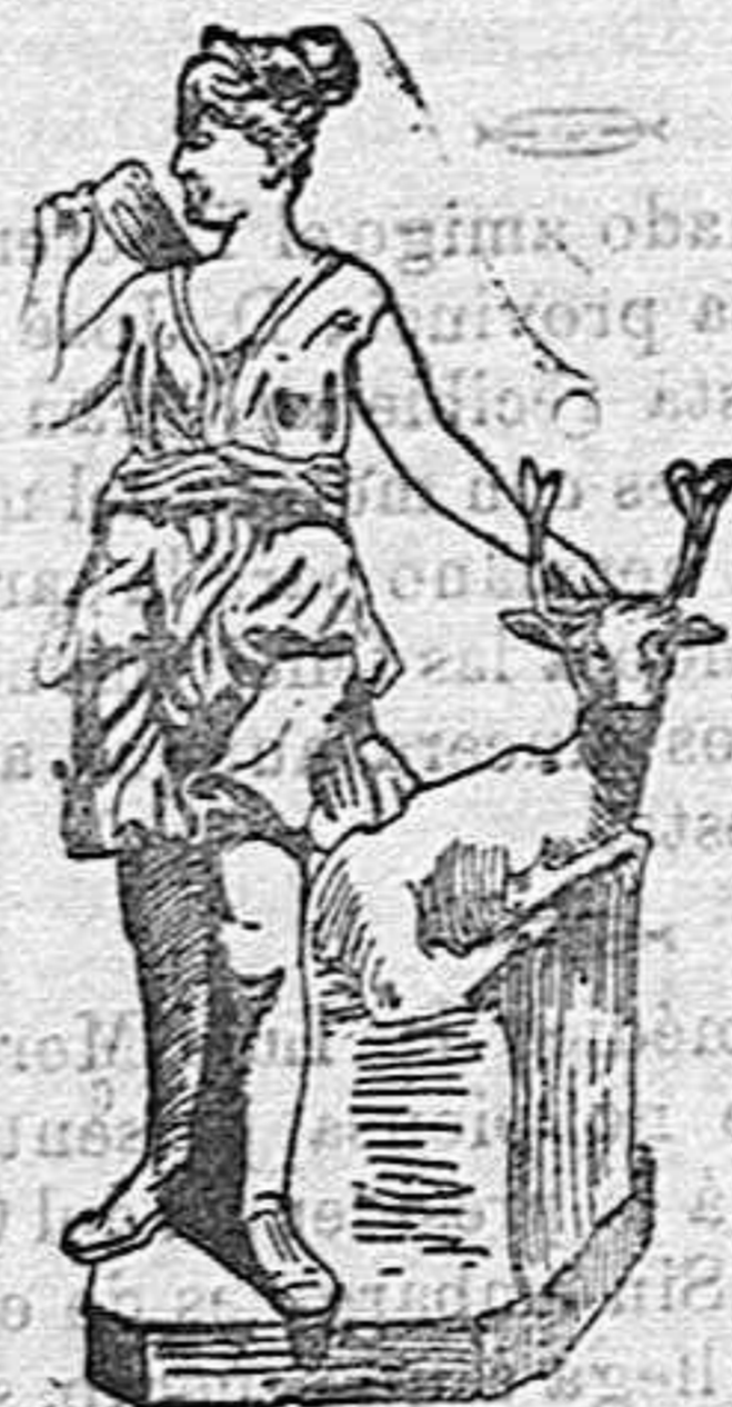
La Venus figurando la estatua de Diana

Porque es el caso que los ingleses, cuya perspicacia es inaudita, han descubierto en una bellísima joven todos los rasgos fisonómicos de la decantada estatua y la dueña de ellos, ventajosamente contratada, exhibese á diario en «Pavilion Theatre.»