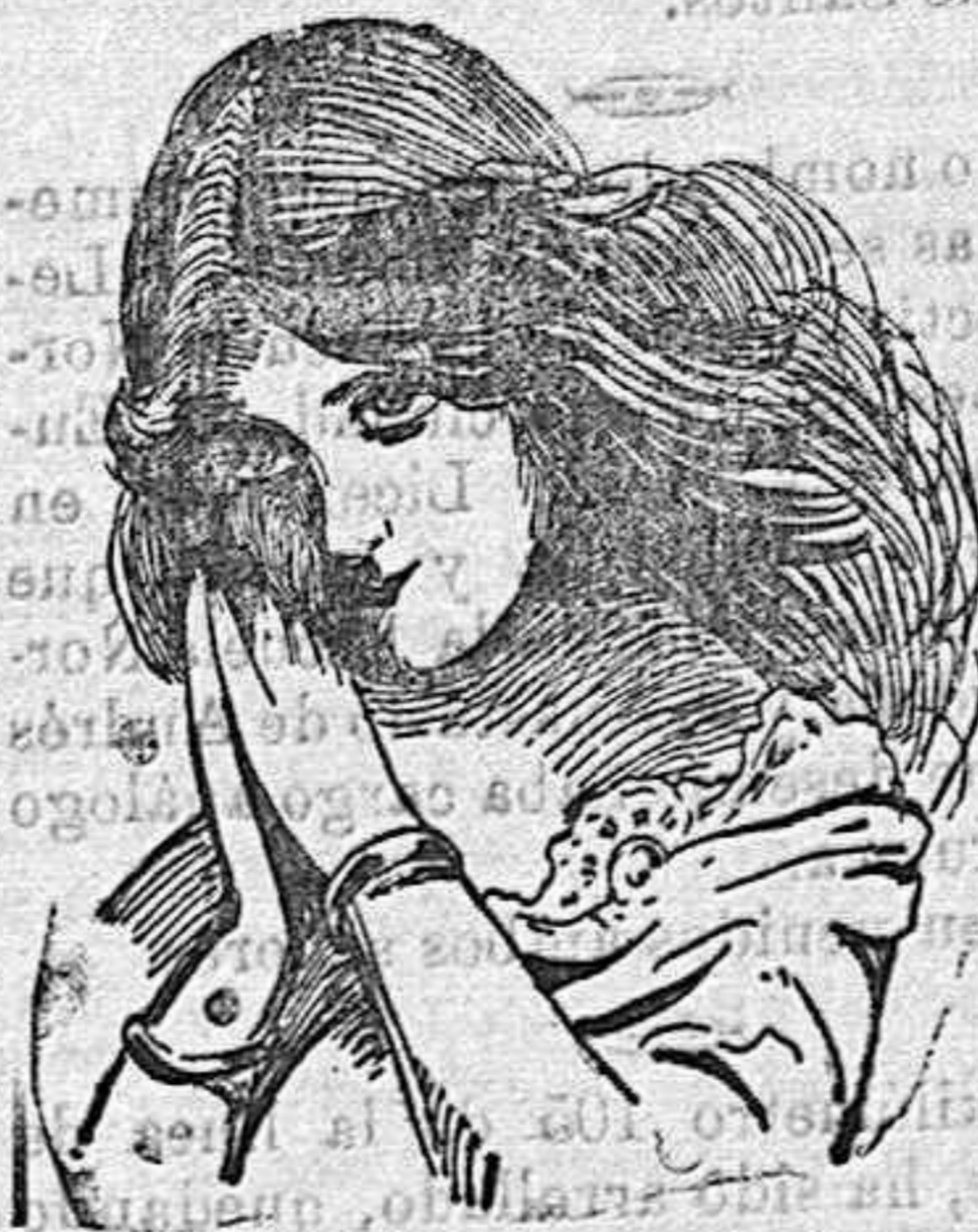
La moderna Venus de Milo.

¿Quién había de decirle á la Venus de Milo que haría furor en el siglo XX? ¿Y quién había de imaginar que aquella escultura que ya se halló sin un brazo, había de mover los dos, y hablar, y cambiar de posturas?