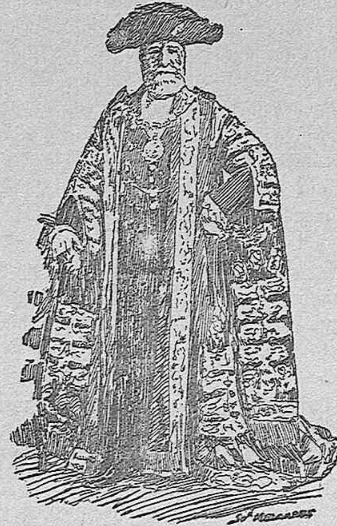
Lord-Corregidor de Londres.

Los franceses, en los que el gusto por las prácticas democráticas del régimen republicano, ha logrado hermanarse con el que produce en monárquicos espíritus la exhibición de lujosas carrozas, galoneadas libreas, palafreros, lacayos, empolvadas pelucas y demás acompañamiento obligado de las fastuosas monarquías, están gozosi-