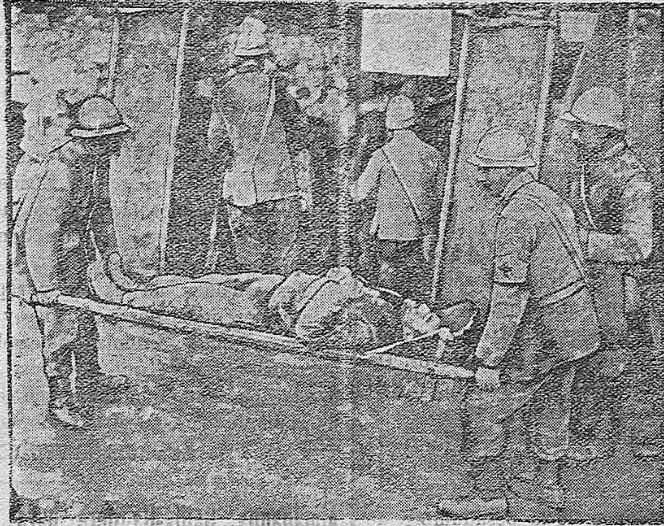
LOS PUESTOS DE SOCORRO

Quando finaliza un avance y se consolida la posición conquistada, la primer preocupación del comandante en las tropas inglesas, es preparar á retaguardia, convenientemente retirados de la línea de fuego, puestos de socorro para los heridos en los asaltos consecutivos que casi siempre suceden en la toma y desalojamiento de las posiciones.