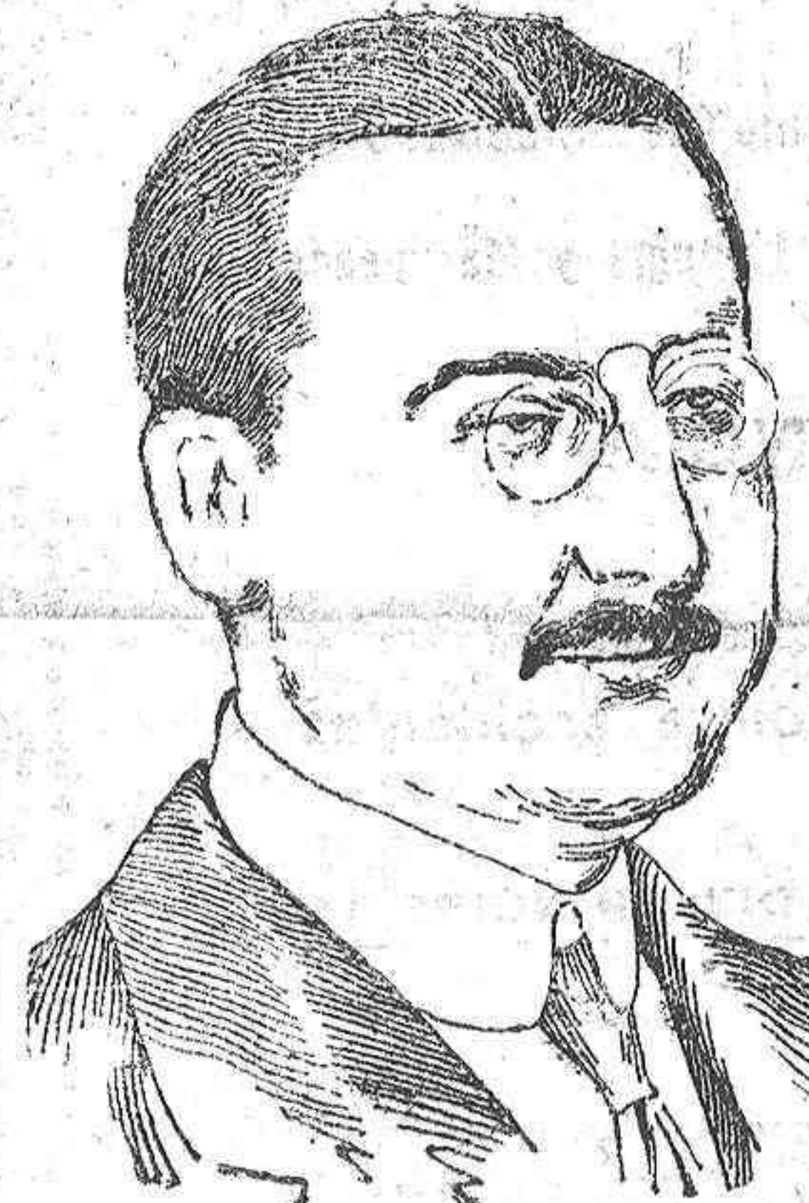
Sr. González Hontoria, nombrado Ministro de Estado.