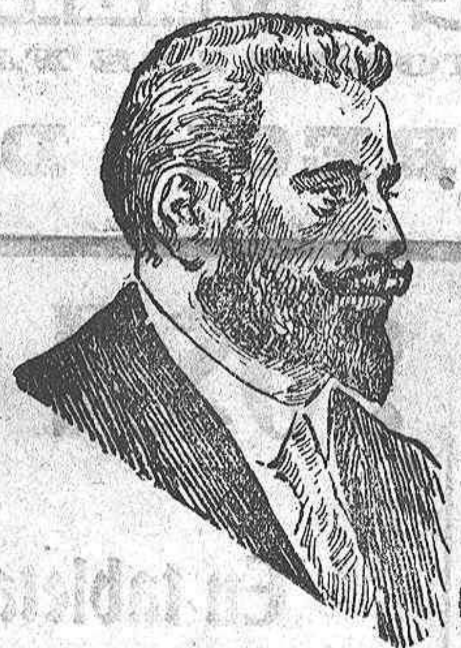
Sr. Bratiano, eminente político italiano y delegado en la Conferencia de la paz