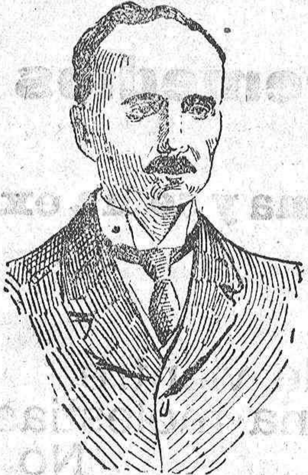
Signor Scialoja ministro italiano delegado en las Conferencias de la paz