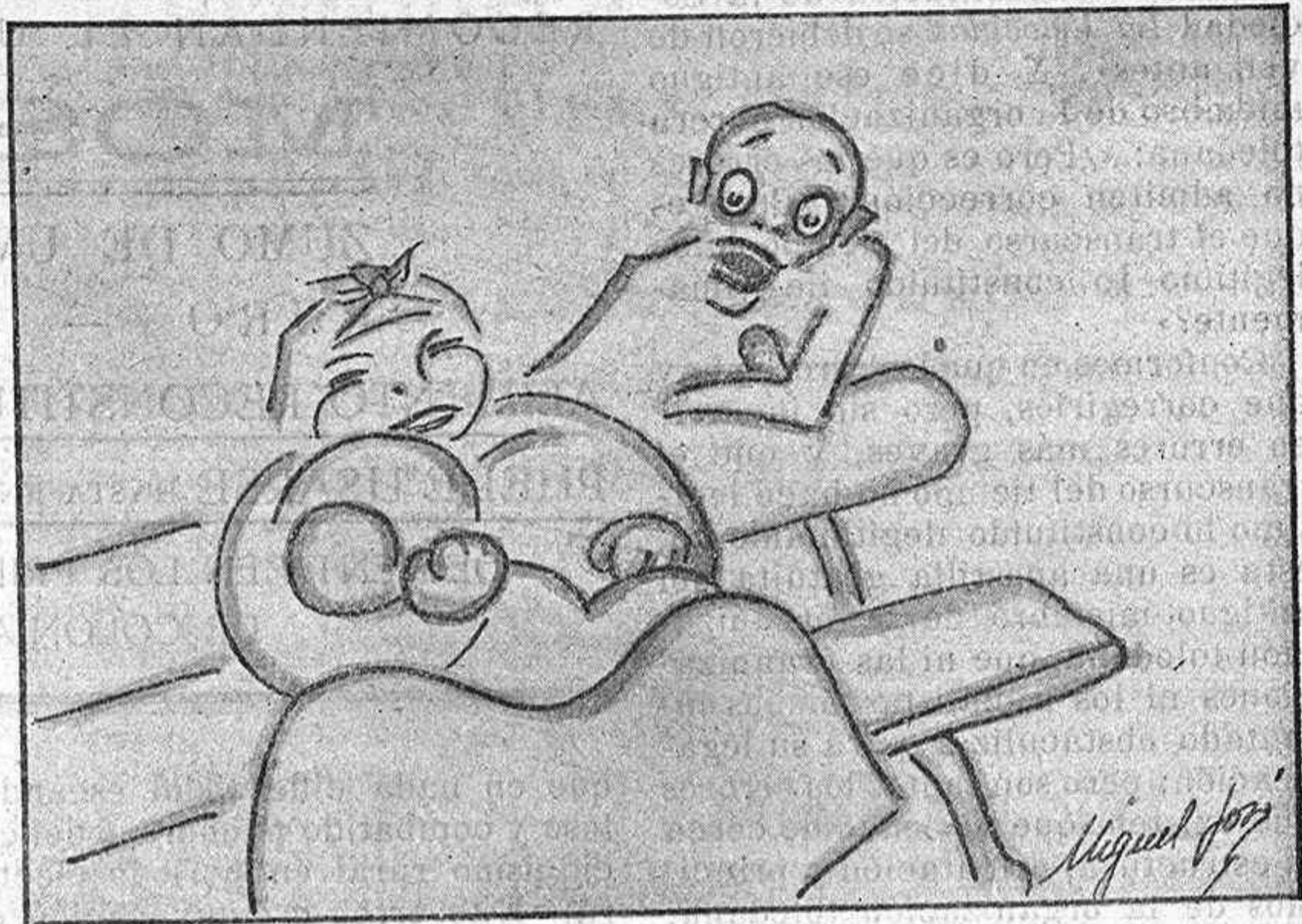
—¡Mi madre! ¡Creí que iba Ud. a soltar un globo!

dana—por una línea de tranvías, que les condujese en unos minutos y por un gasto módico de uno a otro punto, evitándoles con esto fatigas e incomodidades?