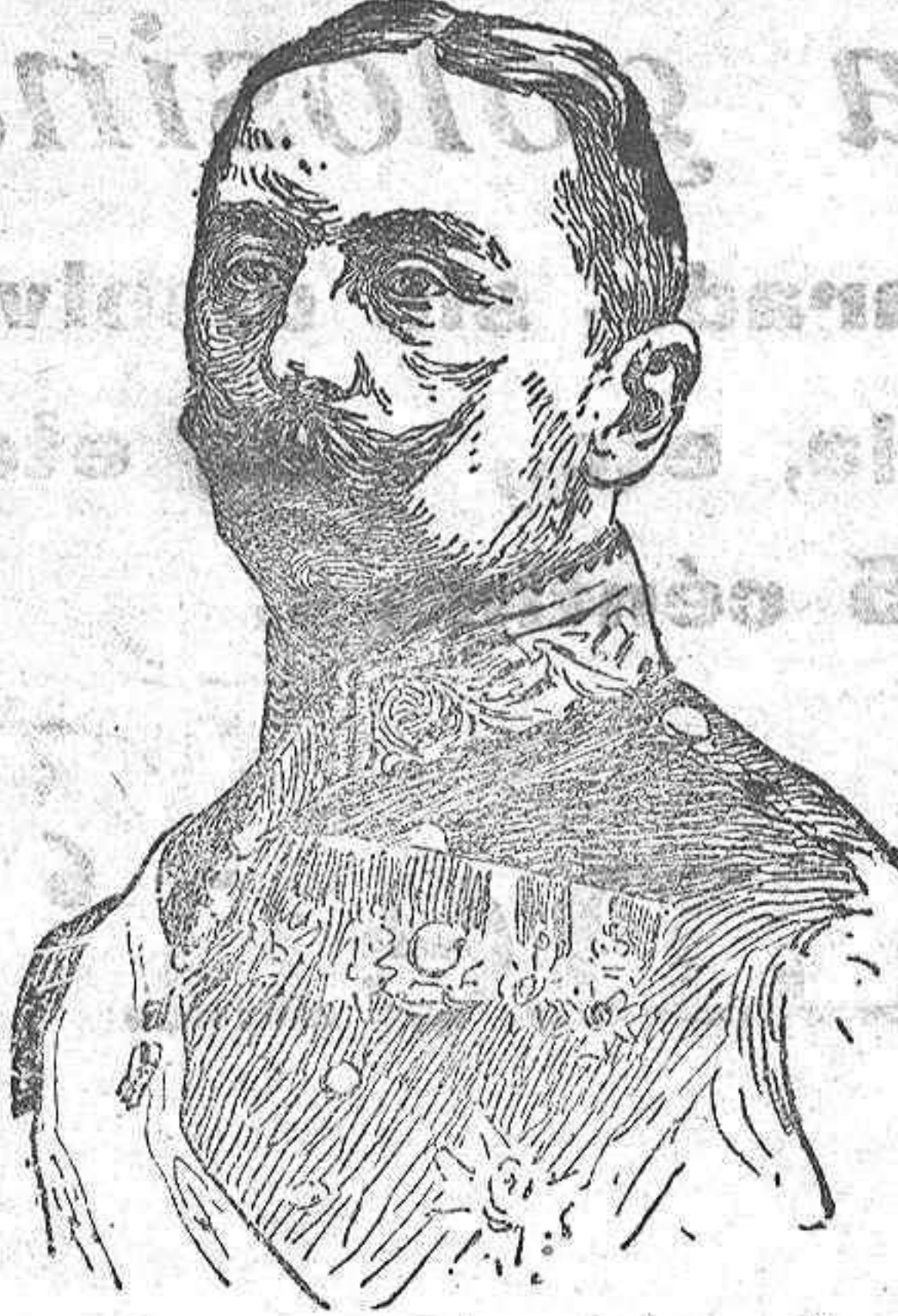
Don Jaime de Borbón que ha enviado un manifiesto a los tradicionalistas que está siendo objeto de muchos comentarios.