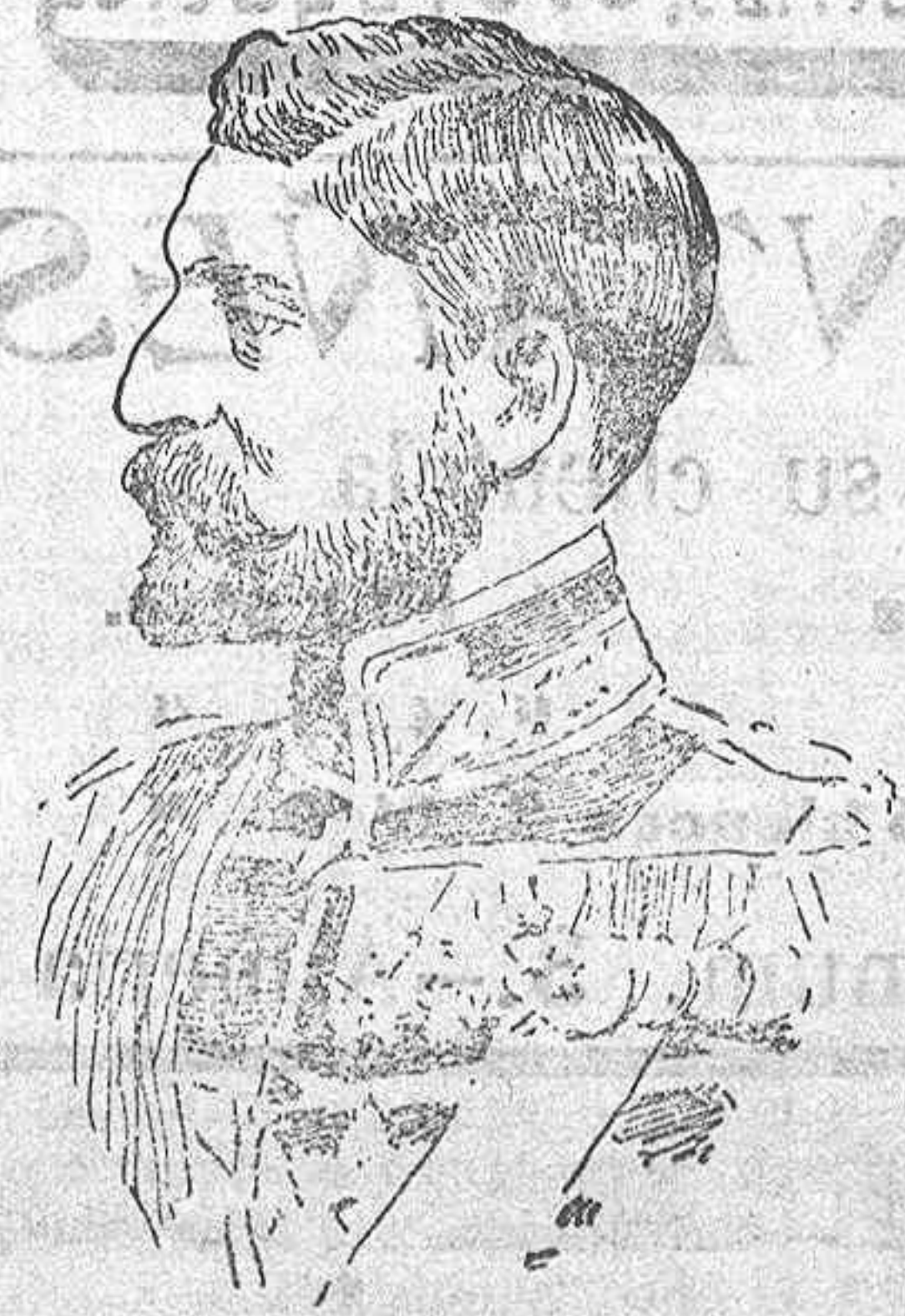
El rey Fernando de Rumania que se dice ha sido herido al estallar la revolución en aquel país.