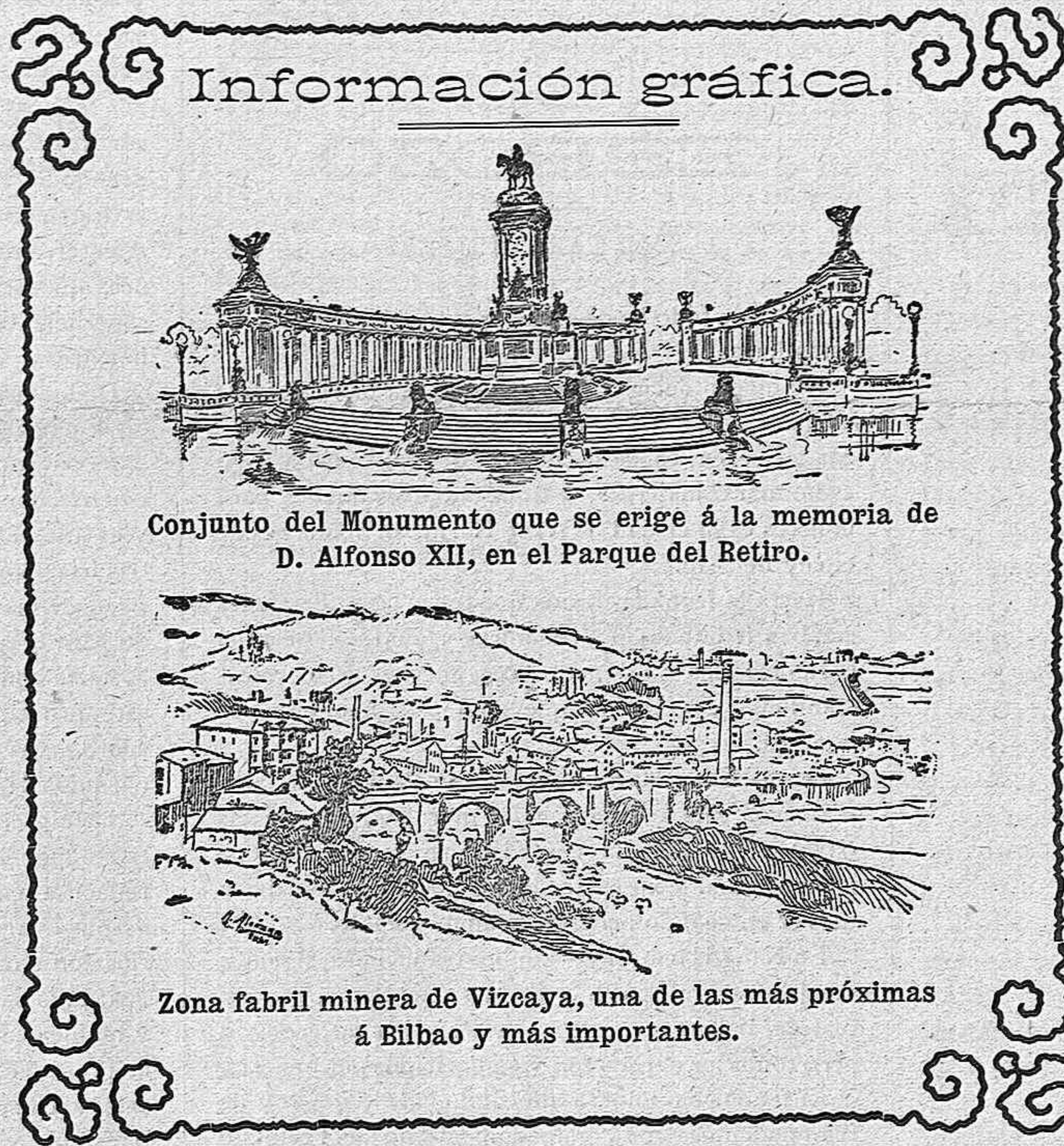
Conjunto del Monumento que se erige á la memoria de D. Alfonso XII, en el Parque del Retiro.