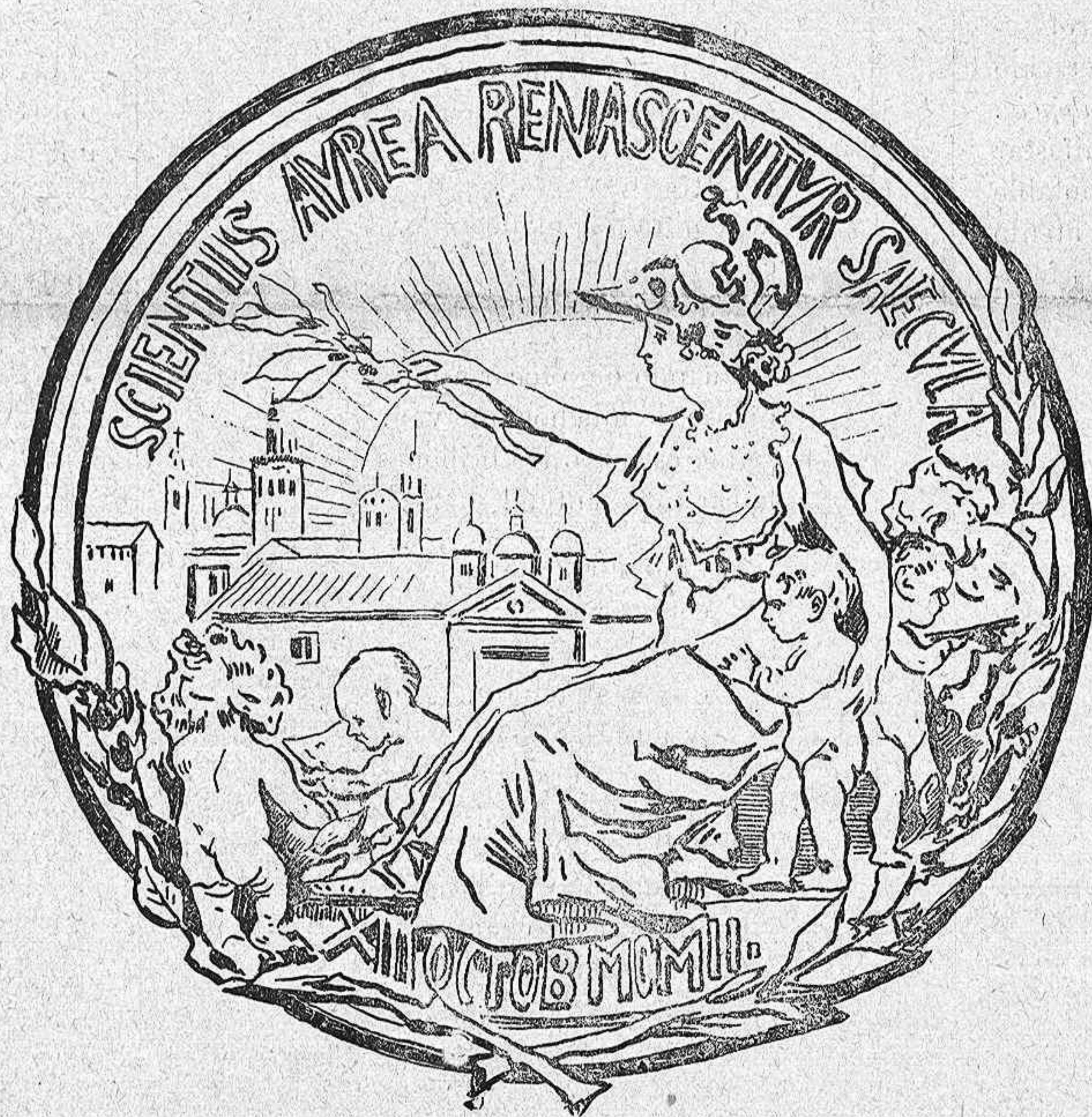
Dibujo á pluma del anverso hecho por el autor.