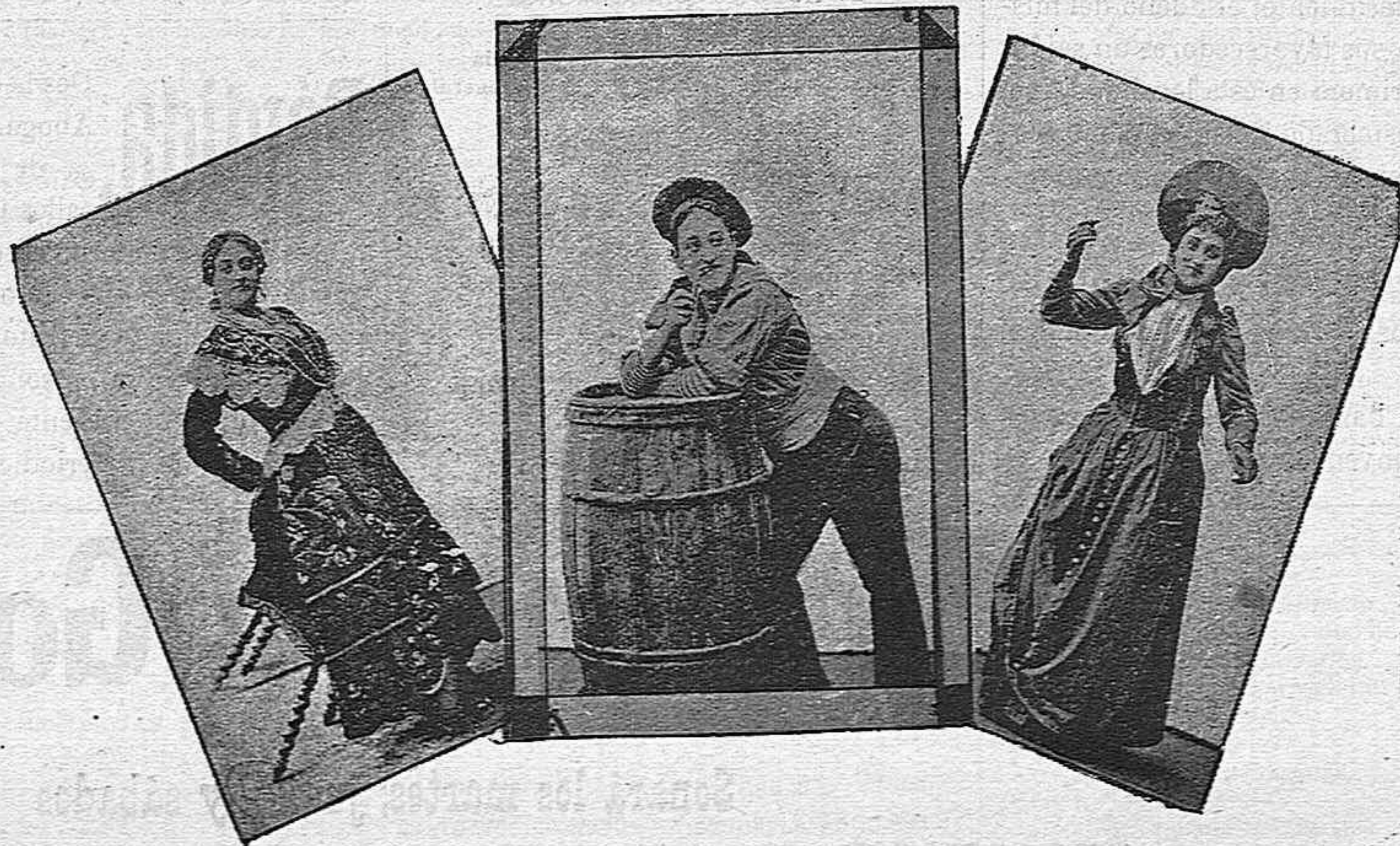
En «El cabo primero», en «El grumete» y en «Miss Helyett».