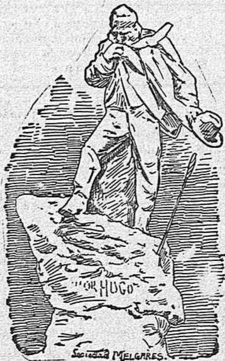
Estatua á Victor Hugo.

Entre los puentes originales cuya construcción no ha menester ingenieros y cuyo empleo data de fecha muy anterior á la del nacimiento de Montero Ríos, López Domínguez y aun del propio Marqués de la Vega de Armijo, figura el que representa el grabado adjunto, y que se emplea para cruzar ciertos ríos y torrentes en algunas partes de Asia, principalmente en la región montañosa y casi desierta de las regiones del Tibet.