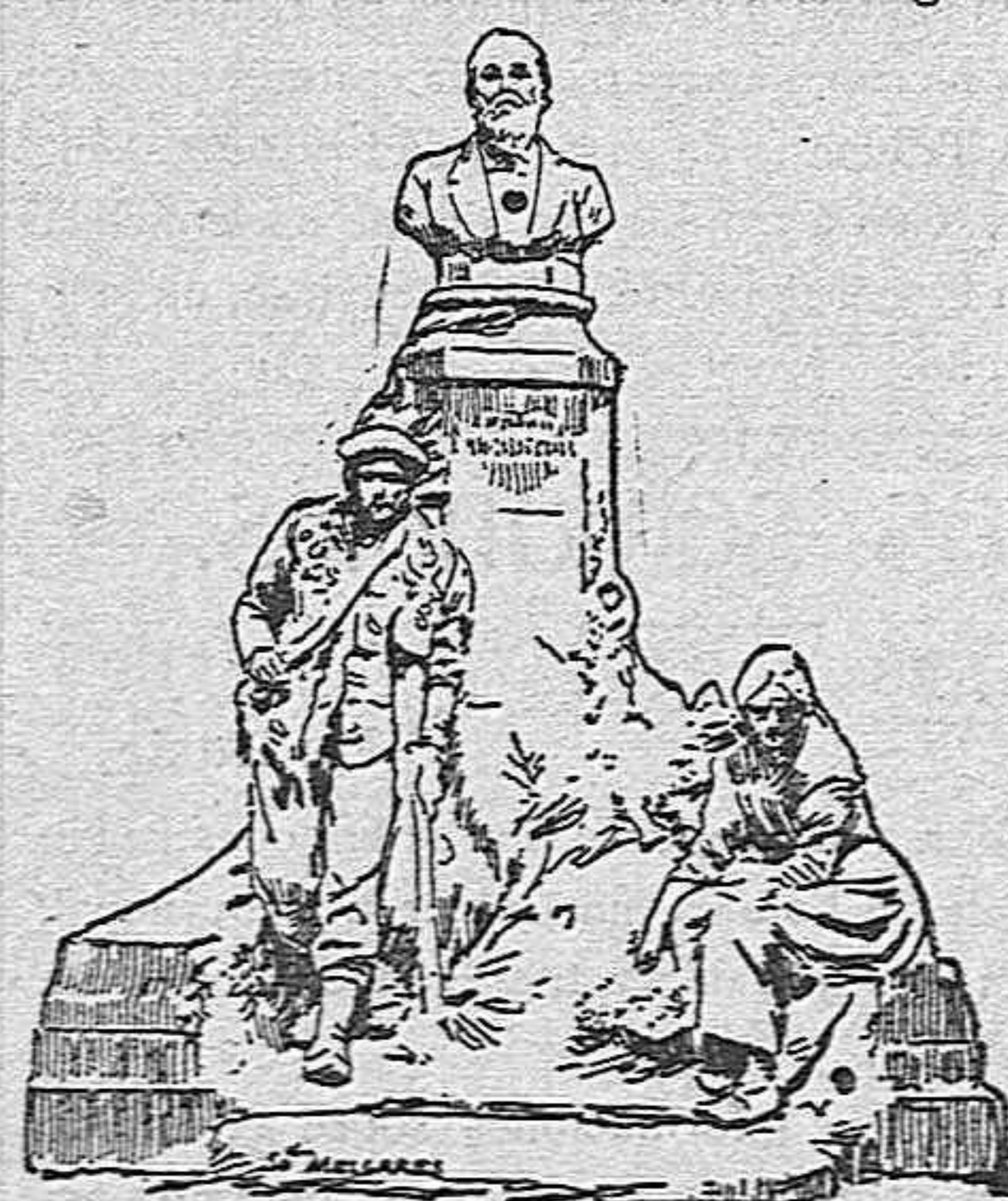
Monumento á Fernand Lafargue.

Burdeos nos ofrece actualmente espectáculo de cultura y ejemplo de meditación, inaugurando en su Jardín de Plantas un notable monumento erigido á la memoria