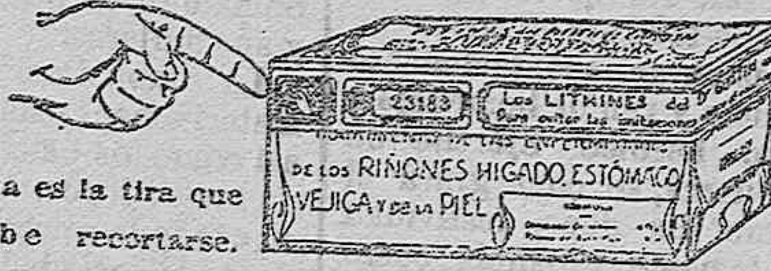
Esta es la tira que debe recortarse.

Representantes generales para España: Establecimientos Dalmáu Oliveres, Sociedad Anónima. P.º Industria, 14. Barcelona.