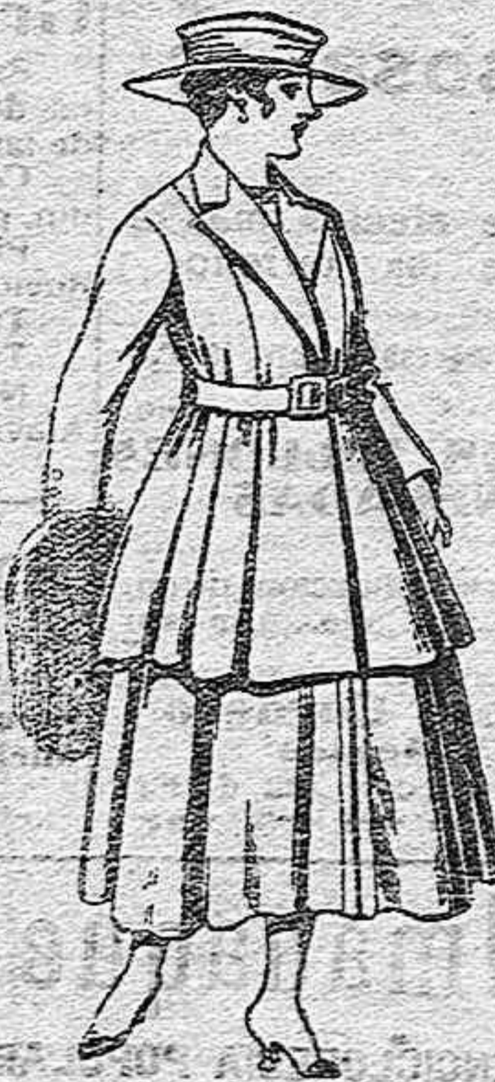
Traje de lana para señora, en color negro y azul, de pesetas 65 a 100.