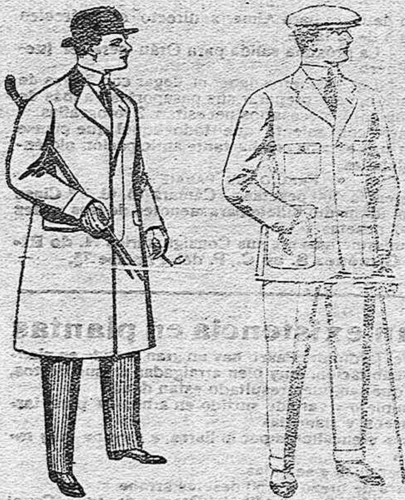
Gabanes de paten, melton y cheviot, con forros seda, saten o escocés, de pesetas 33 a 100.