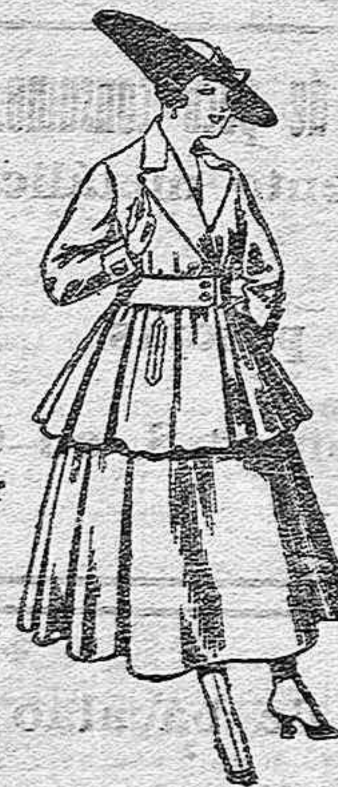
Traje de lana, en negro, azul y color, para señora, de pesetas 90 a 100.