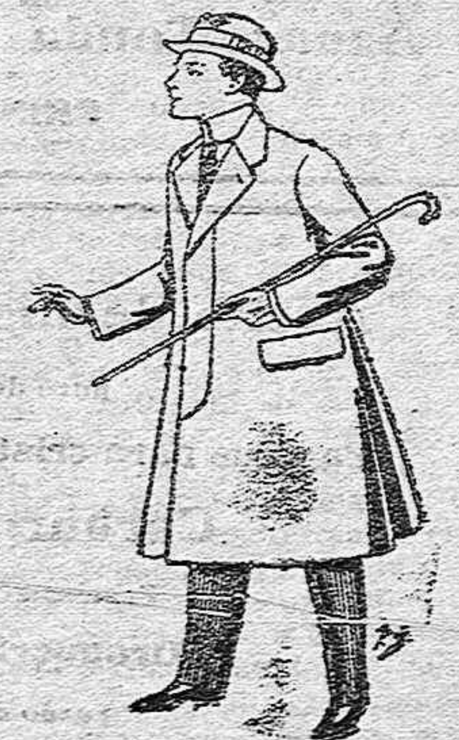
Gabanes de lana, vigoria o melton, con forros saten o seda para niños de 10 a 12 años, de pesetas 20 a 33.