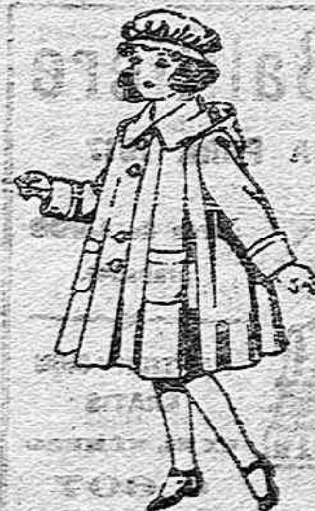
Abrigos de paten, para niñas de 4 a 9 años, de pesetas 22 a 33.