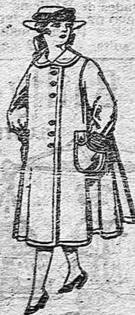
Abrigos de lana para jovencitas de 11 a 15 años, de ptas. 35 a 40