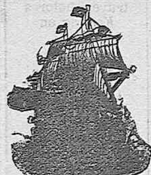
con escalas en Las Palmas (Canarias), Rio de Janeiro, Santos y Montevideo.

NOTA.—Los señores viajeros deberán pedir las plazas y mandar sus documentaciones con bastante anticipación. El despacho de billetes quedará cerrado el día anterior al de la salida del buque.