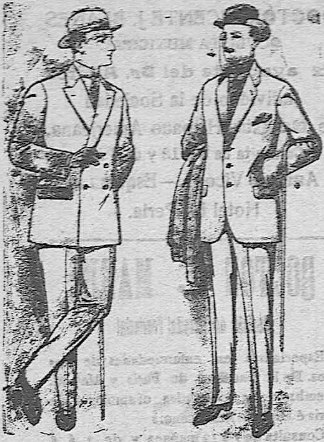
Trajes de cheviot patén, etc. De pesetas 27 á 85 Trajes de patén cheviot cordero. De pesetas 17'50 á 80