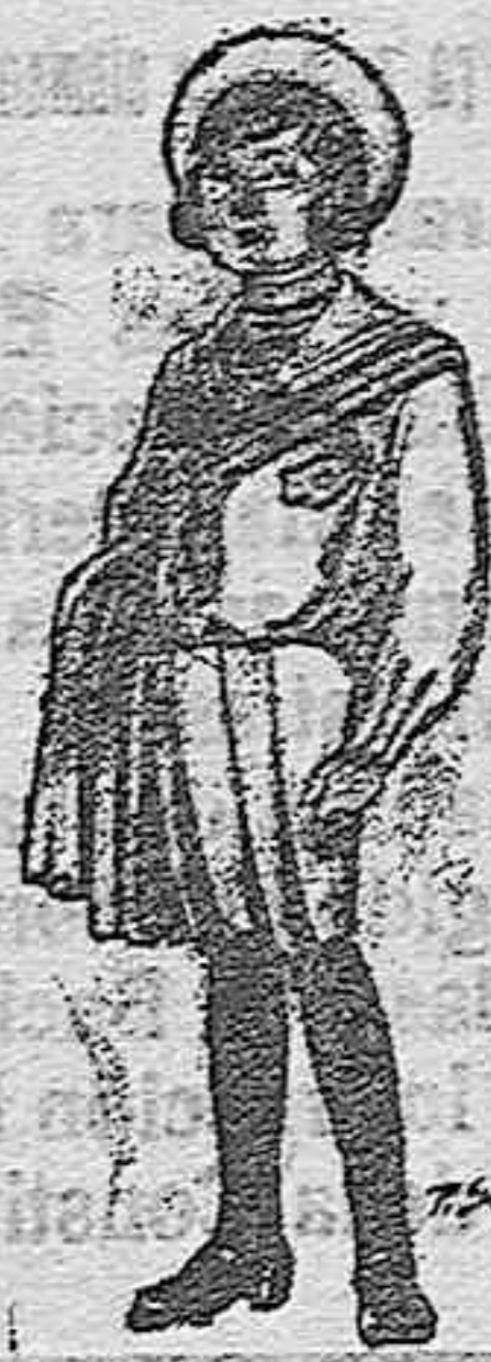
Trajes de jergal negro ó azul para niños de 4 á 9 años. De pts. 5 á 10.