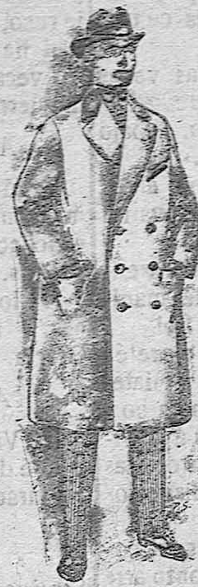
Gabares de patén cheviot etc. De pesetas 55 á 105