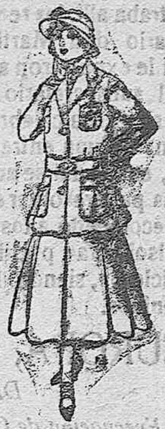
Trajes de lana para jovencitas de 13 á 16 años. De pesetas 40 á 45.