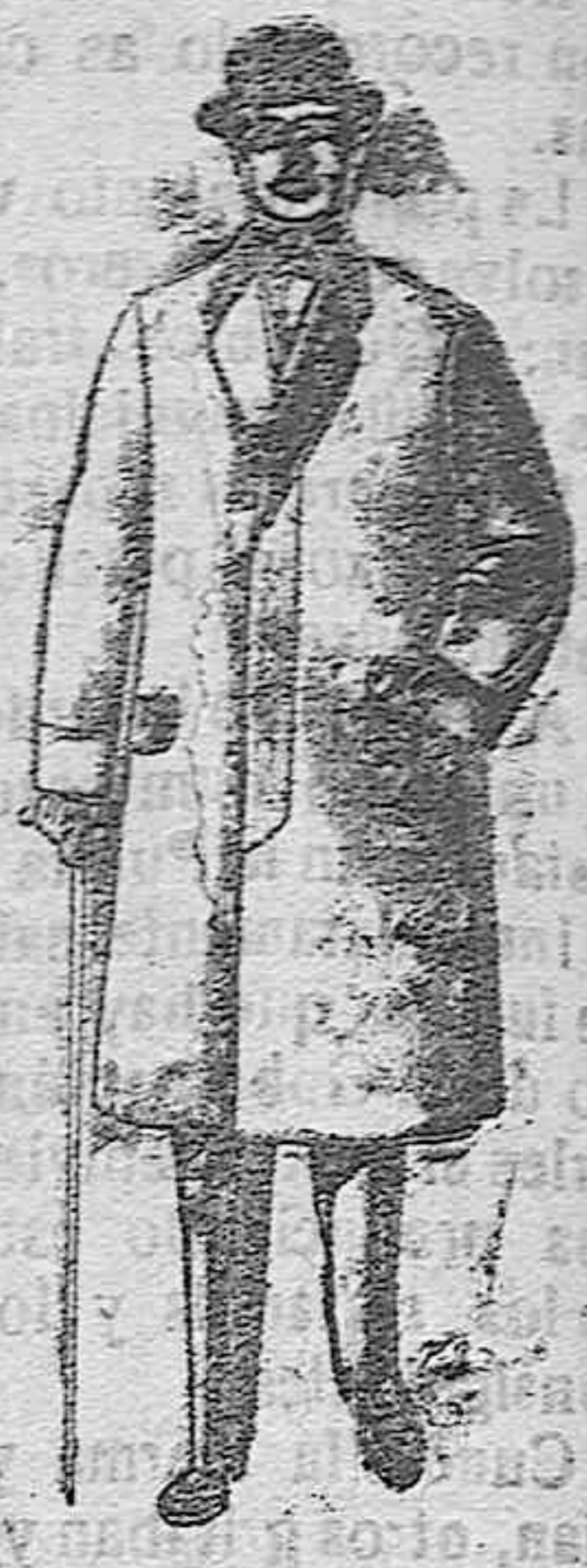
Gabanes de patén, n. el tón y cheviot. De pesetas 25 á 100