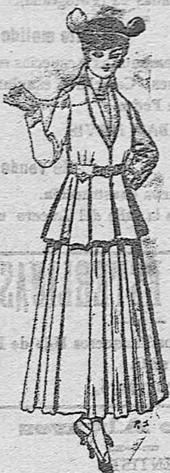
Trajes de lana negra, azul y de color, para señora. A pesetas 85,