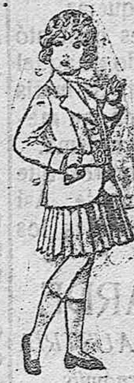
Trajes de lana para niñas de 4 á 12 años. De pesetas 20 á 35