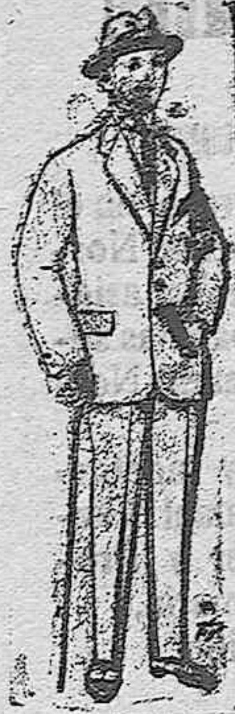
Trajes de patén vicuña ó jerga para niños de 10 á 15 años. De pts. 14 á 50