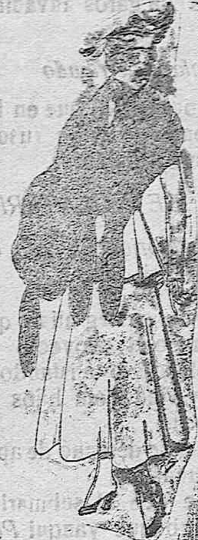
Juego de pieles imitación perfecta al renar-negro. De pts. 40 á 40