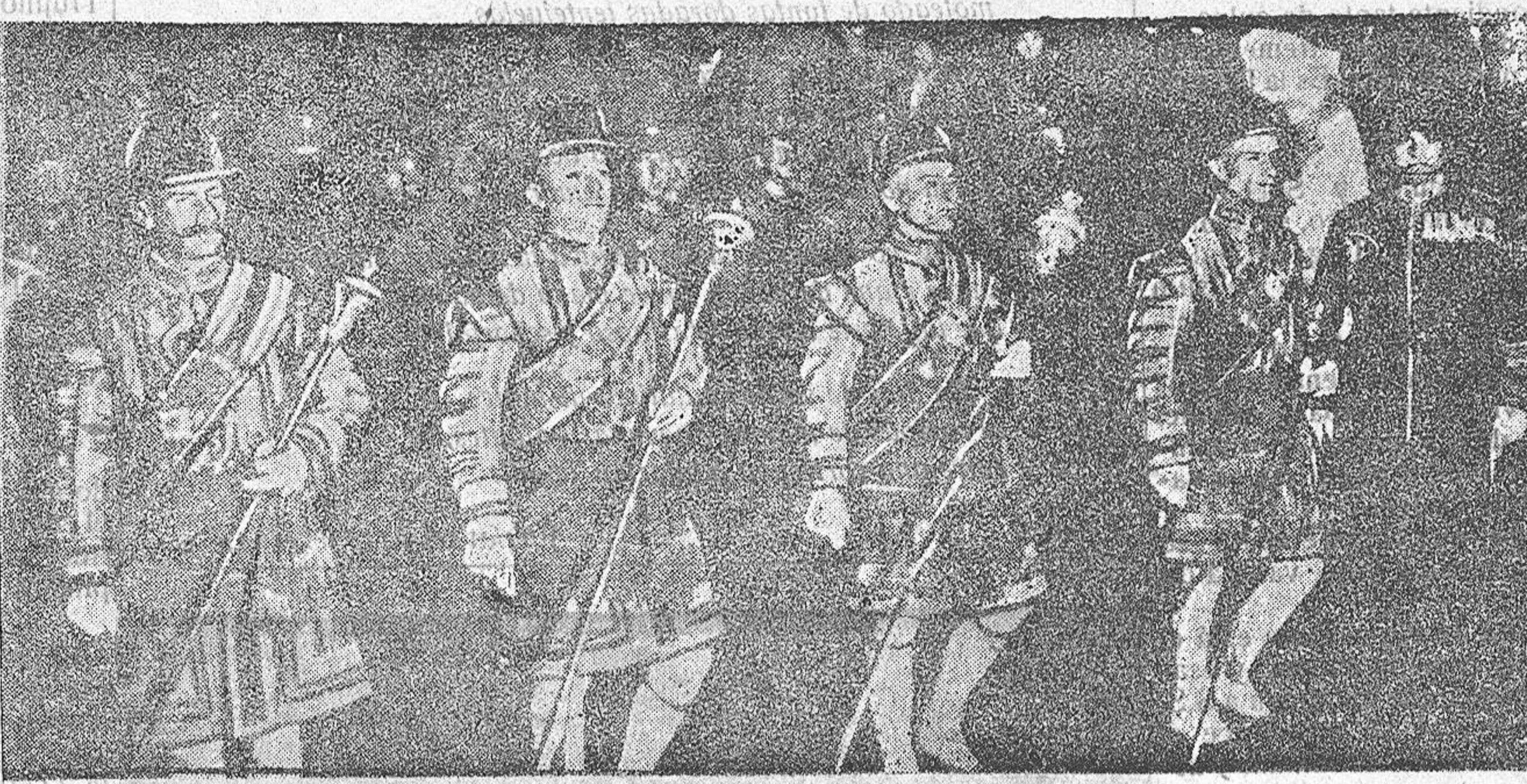
MÚSICA DE LA GUARDIA REAL INGLESA QUE HA LLEGADO A PARÍS PARA DAR CONCIERTOS A BENEFICIO DE LOS HERIDOS DE LA GUERRA

El gobernador dió cuenta de un telegrama de la Dirección General de Obras Públicas, concediéndoles 20 wagoes de carbón que tenían solicitados varios comerciantes de esta plaza.