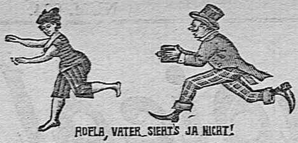
ROELA, WATER-SHETS JA NICHT!

Accesorios fotográficos de todas clases Laboratorio é instrucciones gratis