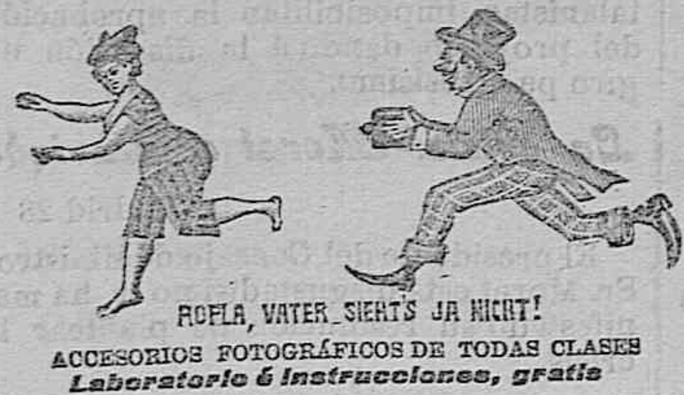
ROFLA, WATER, SIERTS JA NIGHT! ACCESORIOS FOTOGRAFICOS DE TODAS CLASES Laboratorio e Instrucciones, gratis