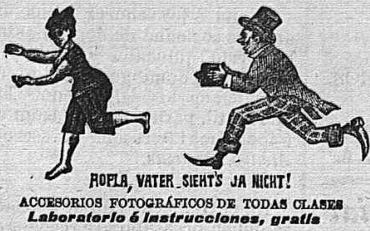
ROFLA, WATER, SIEN'TS JA NICHT! ACCESORIOS FOTOGRAFICOS DE TODAS CLASES Laboratorio e Instrucciones, gratis