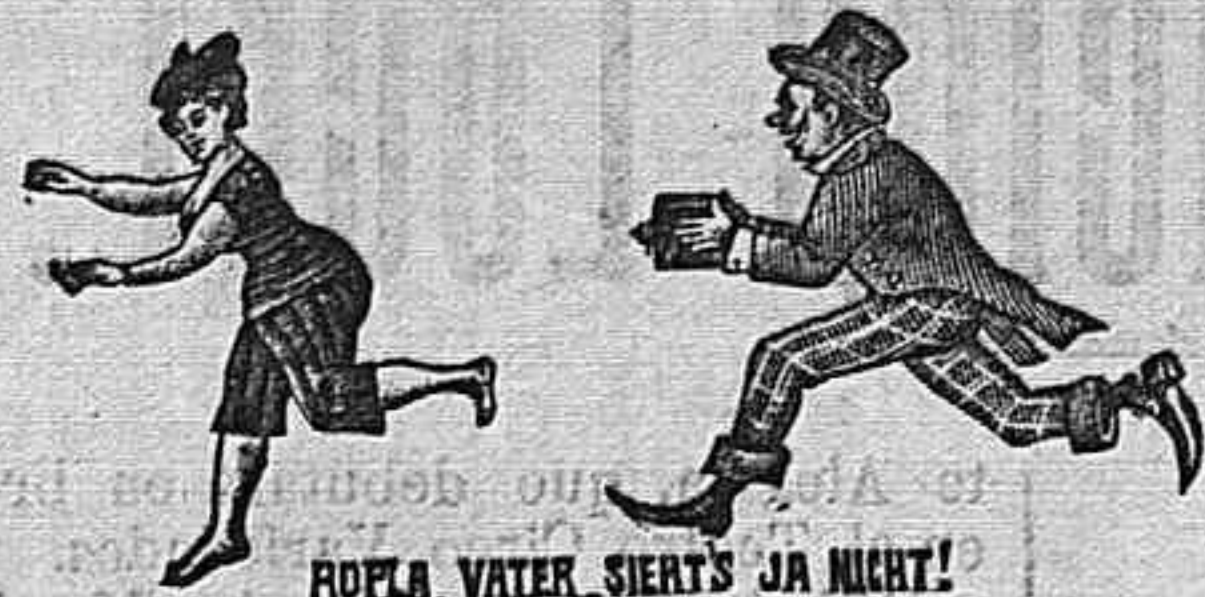
POPEA, VATER, SIERTS 'JA NIGHT'

PINTURAS DE ESMALTE Inmenso surtido en hermosos colores, envasados en elegantes cajitas de todos precios Productos mata moscas, chinches, etc. AGUAS DE PATERNA, Y OTRAS tambien medicinales