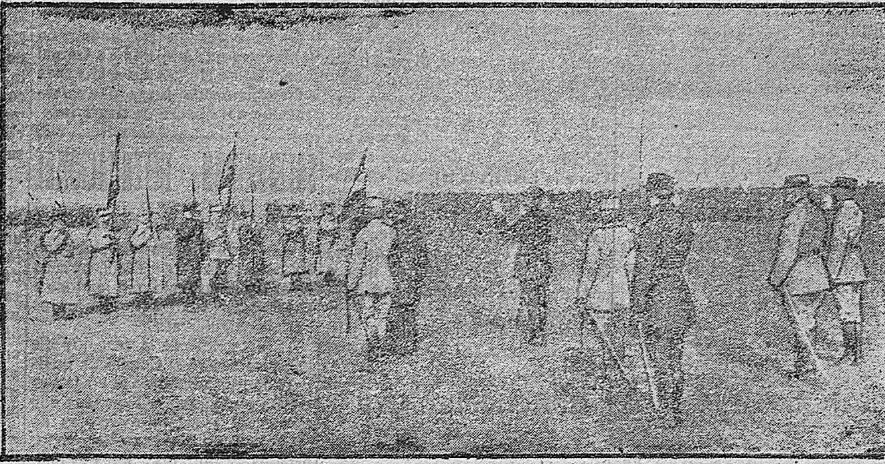
CEREMONIA EN HONOR DEL AVIADOR GUYNEMER