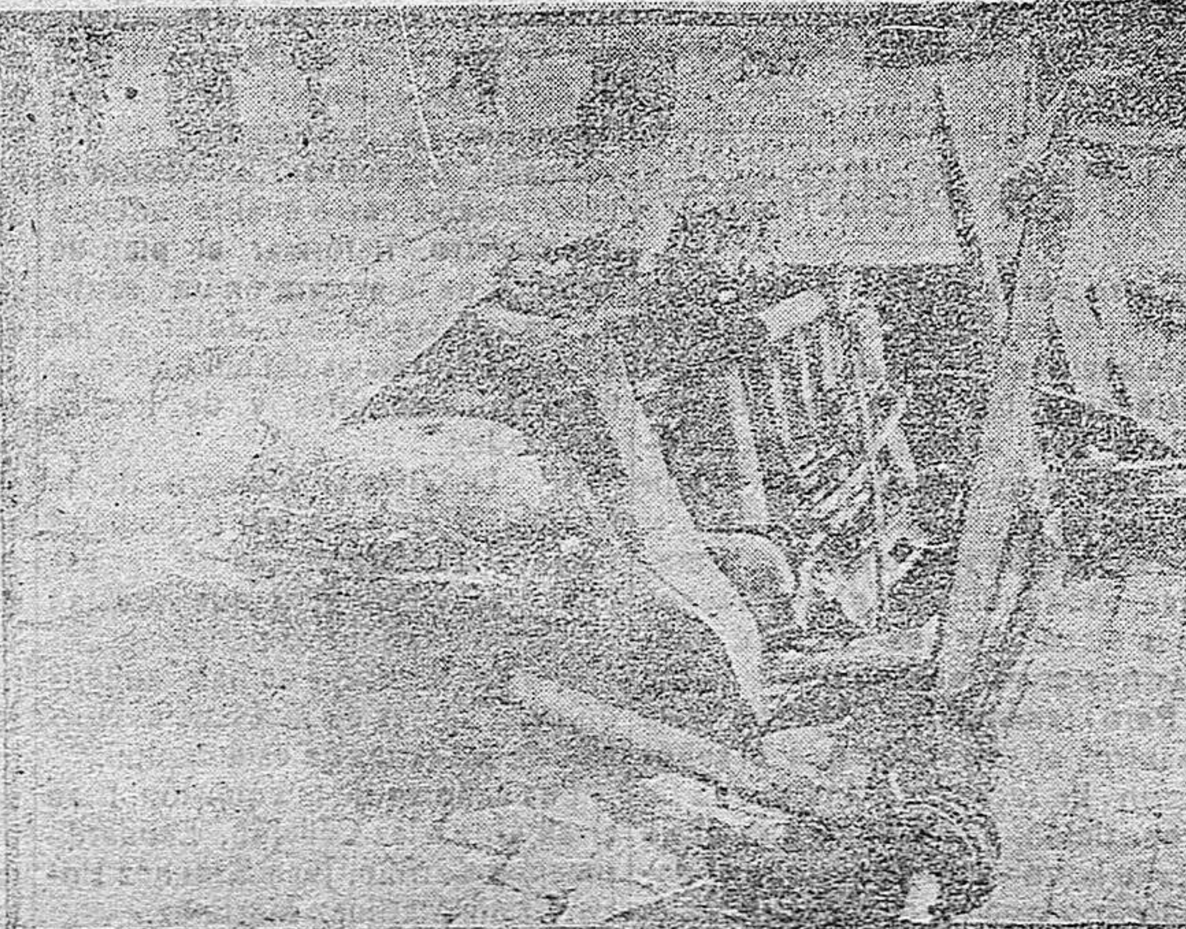
RESTOS DE UN AEROPLANO ALEMÁN DERRIBADO EN DUNKERQUE