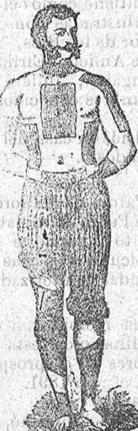
Trade Mark Registered

PERFORADOS AMERICANOS DE FIELTRO ROJO DEL doctor Winter.