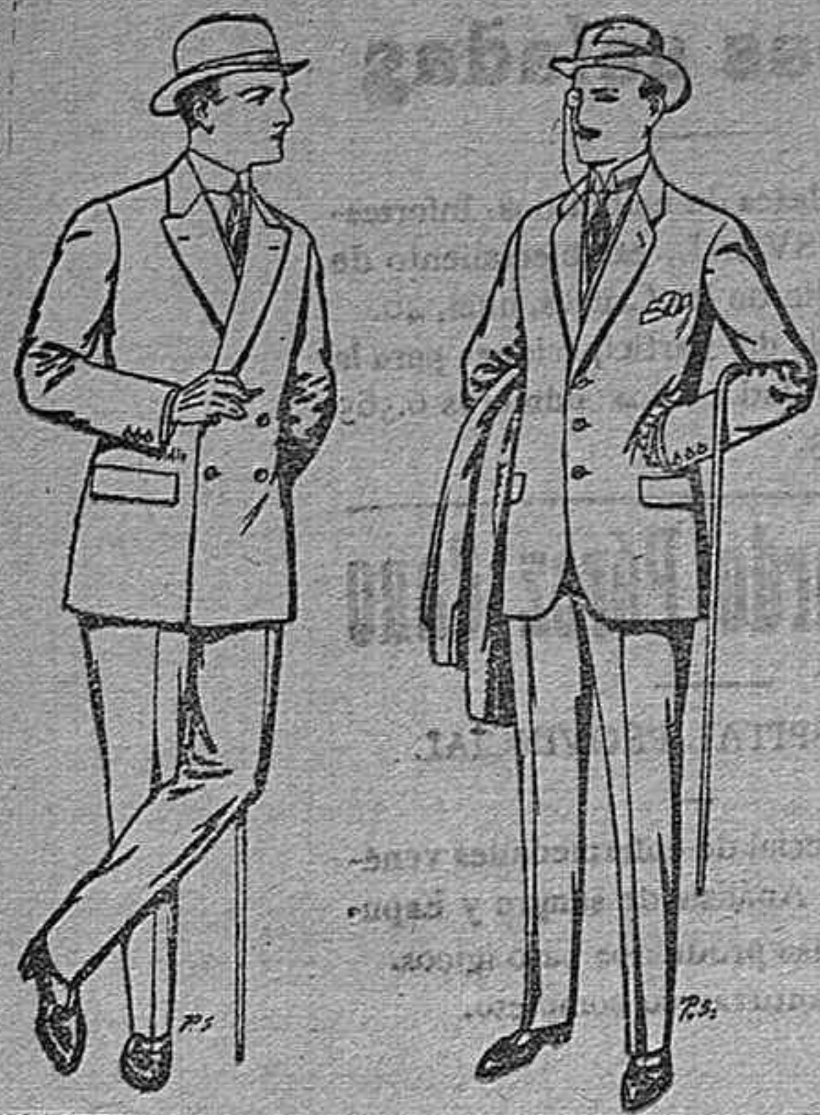
Trajes de cheviot patén, etc. De pesetas 27 á 85 Trajes de patén cheviot etcétera. De pesetas 17'50 á 80