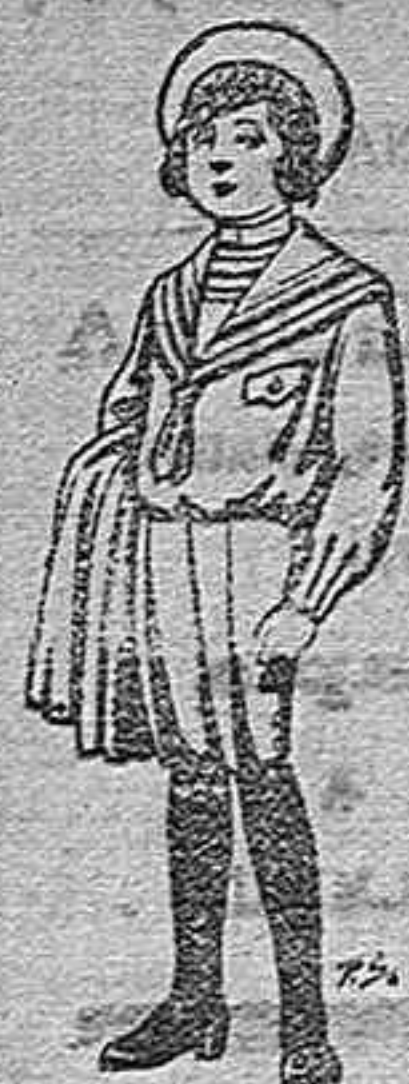
Trajes de jergal negra ó azul para niños de 4 á 9 años. De pts. 5 á 10.