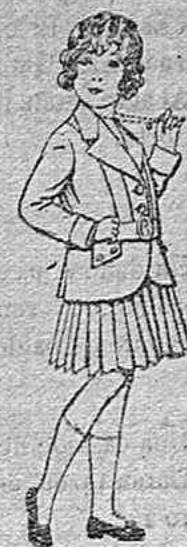
Trajes de lanilla para niñas de 4 á 12 años. De pesetas 20 á 35