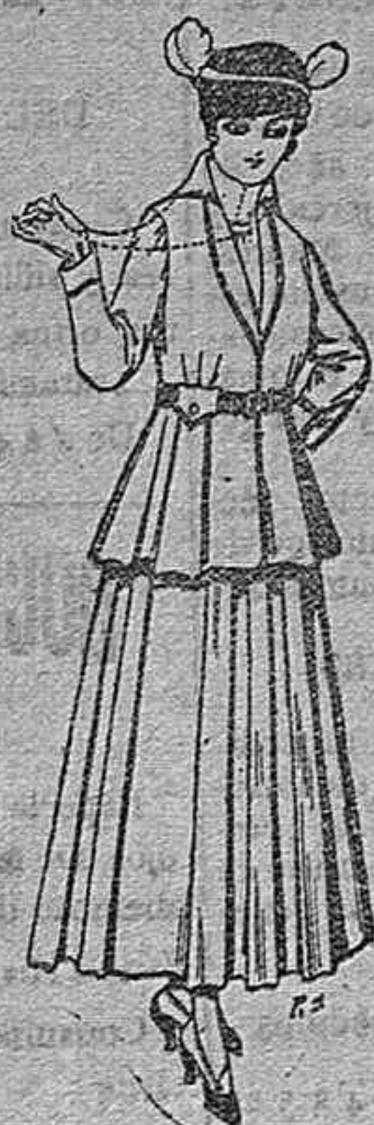
Trajes de lana negra, azul y de color, para señora. A pesetas 85,