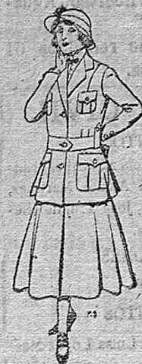
Trajes de lana para jovencitas de 13 á 16 años. De pesetas 40 á 45.