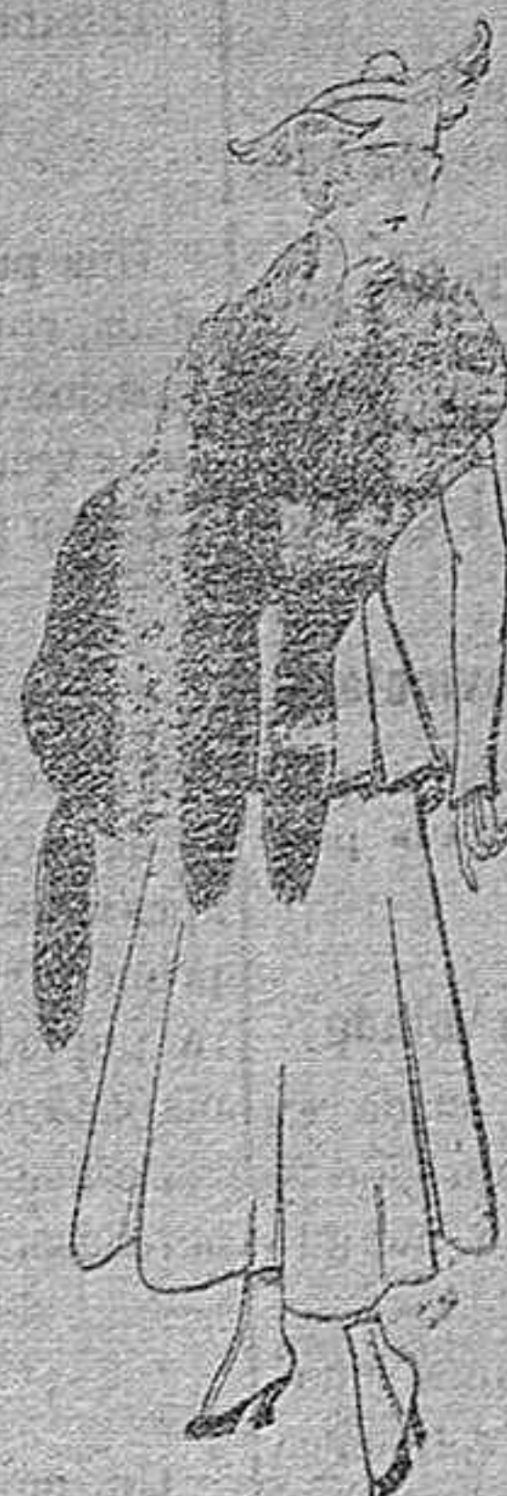
Juego de pieles imitación perfecta al renard negro. De pts. 40 á 45