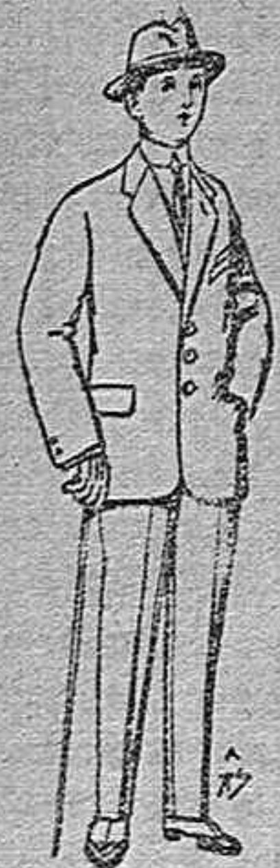
Trajes de patén vicuña ó jerga para niños de 10 á 16 años. De ptas. 14 á 50