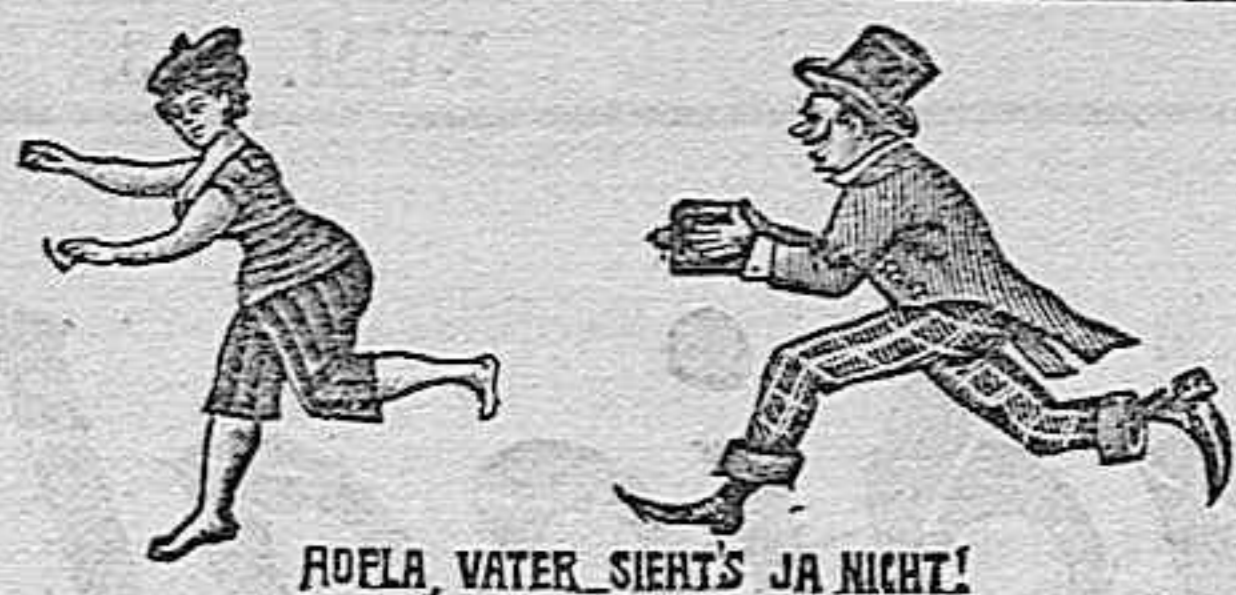
ROELA, WATER, SIEHT'S JA NICHT!

Accesorios fotográficos de todas clases Laboratorio é instrucciones gratis