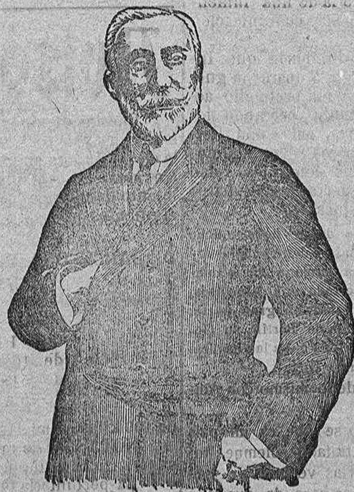
DON ANTONIO MAURA llamado por el Rey para formar Gabinete de Concentración, sin haber podido conseguirlo.