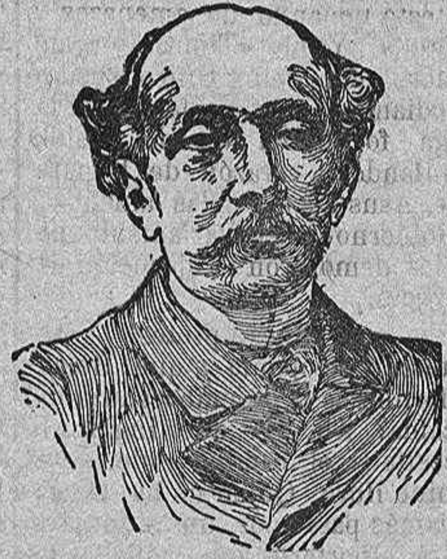
Don Eduardo Dato

Nos parece de perlas la medida, ya que hoy por hoy no podemos aconsejar aquello de «cuatro tiros y al calabozo»; pero como el abuso de los vendedores de pescado es mayor cada día, dándose el caso de pregonarse la sardina a «una peseta un kilo», por encima de las multas y por encima de cuantas medi-