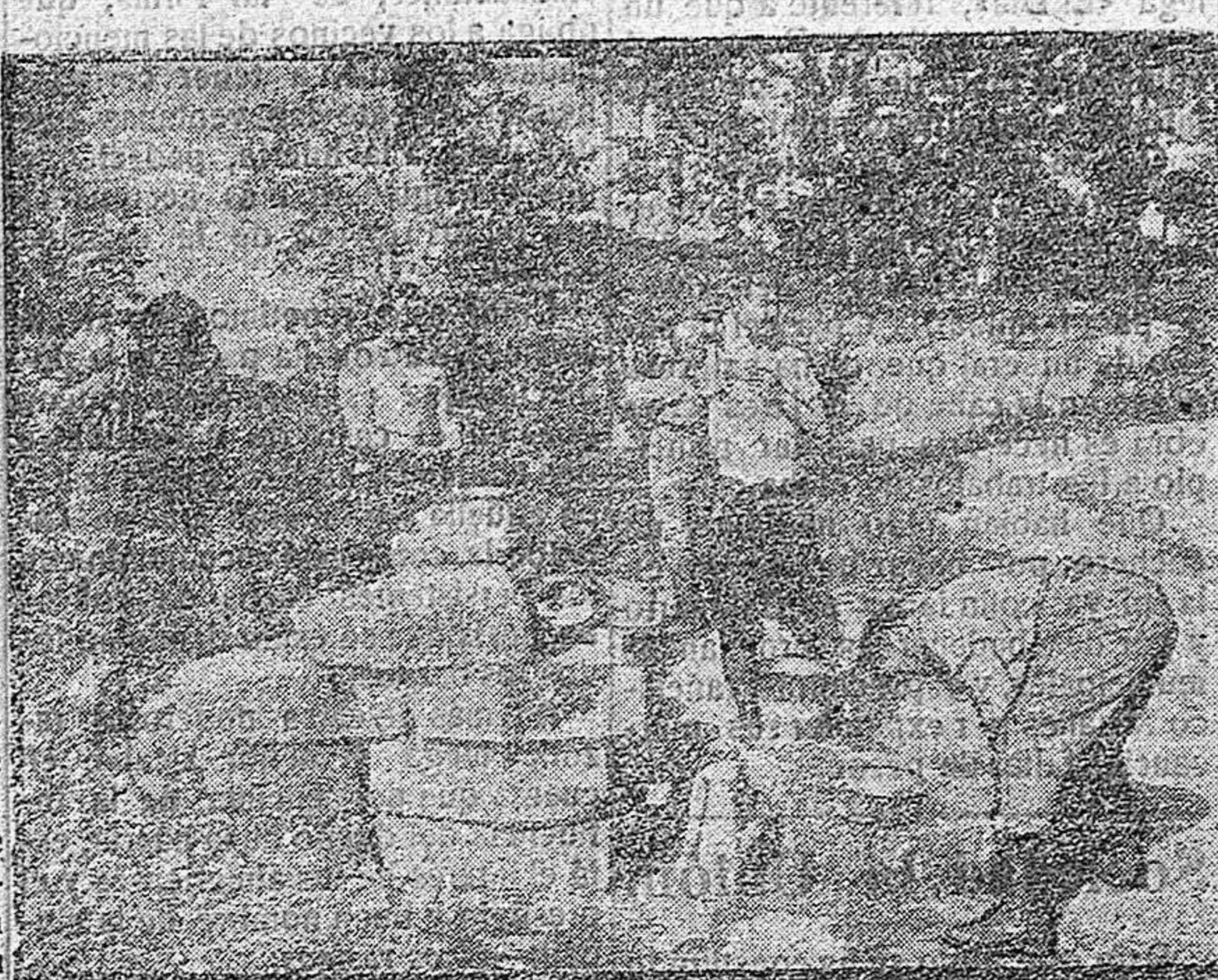
UN CUARTO DE ASEO EN CAMPAÑA

El 18 de Diciembre de 1773 vio el primer acto insurreccional. Aquel día, los habitantes de Boston, amotinados, arrojaron al agua los cargamentos de the, para protestar contra los derechos que Inglaterra pretendía hacerles pagar. Se sabe, en efecto, que la sublevación de las colonias inglesas trasatlánticas fue motivado por una política mezquina que quería mantener bajo una tutela económica las posiciones de allende el mar. Exasperado por una larga polémica que comenzó en 1774 se reunió en Filadelfia el primer Congreso continental, agrupándose en él cincuenta delegados de todas las colonias, a excepción de la Georgia, bajo la presidencia de Peyton Randolph. Este Congreso reivindicó el derecho, para las colonias, de fijar su legislación, decretó el de petición y el de reunión e instituyó el jurado. He aquí, pues, una gran fecha que debe ser recordada.