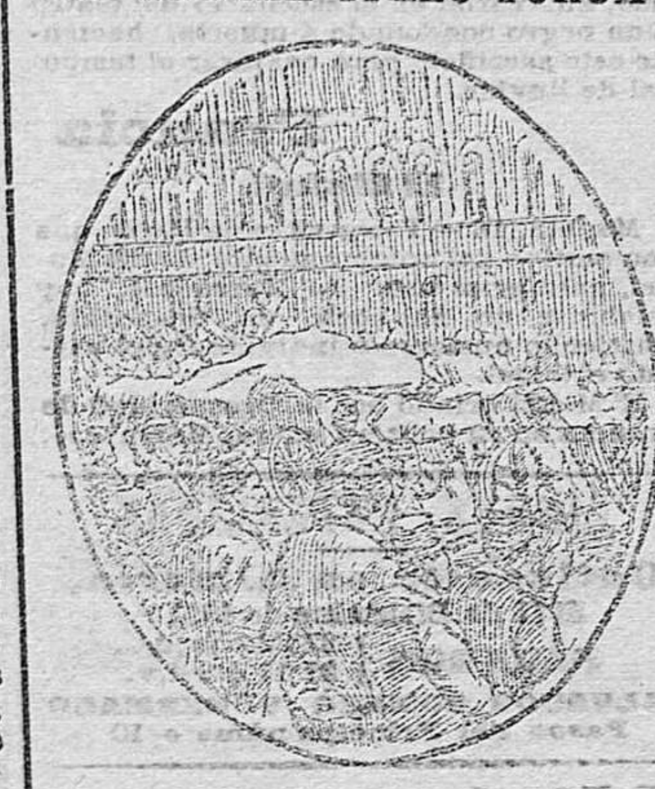
Tropas regulares turcas desfilando por una calle de Constantinopla, para embarcar con destino a uno de los fuertes de los Dardanelos.