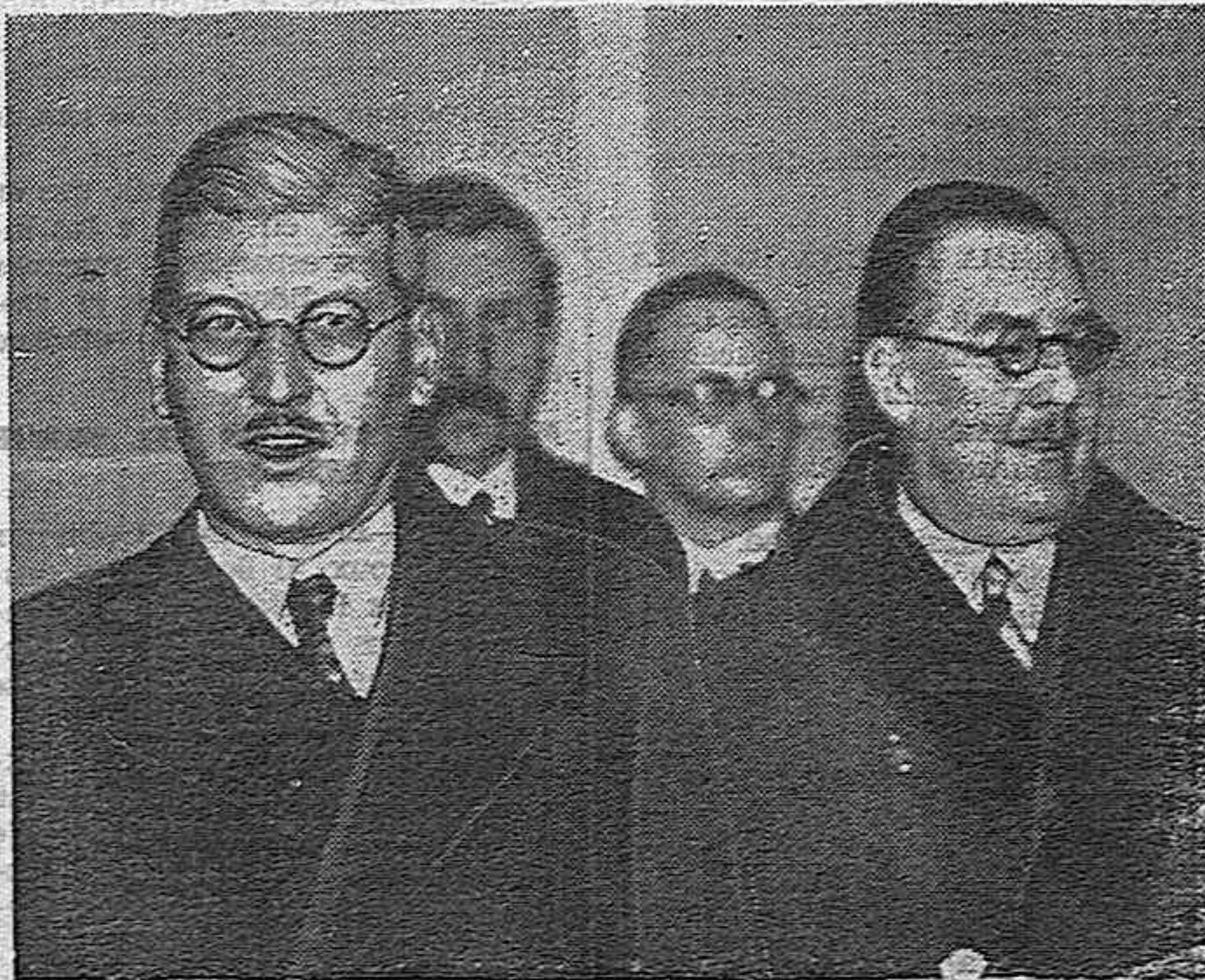
LAS CONFERENCIAS DE PARÍS Y LONDRES

Más del 70 o/o de los automóviles que se construyen en América van equipados con la bujía A. C. La bujía A. C. de fabricación americana se halla ahora de venta en todos los establecimientos del ramo.