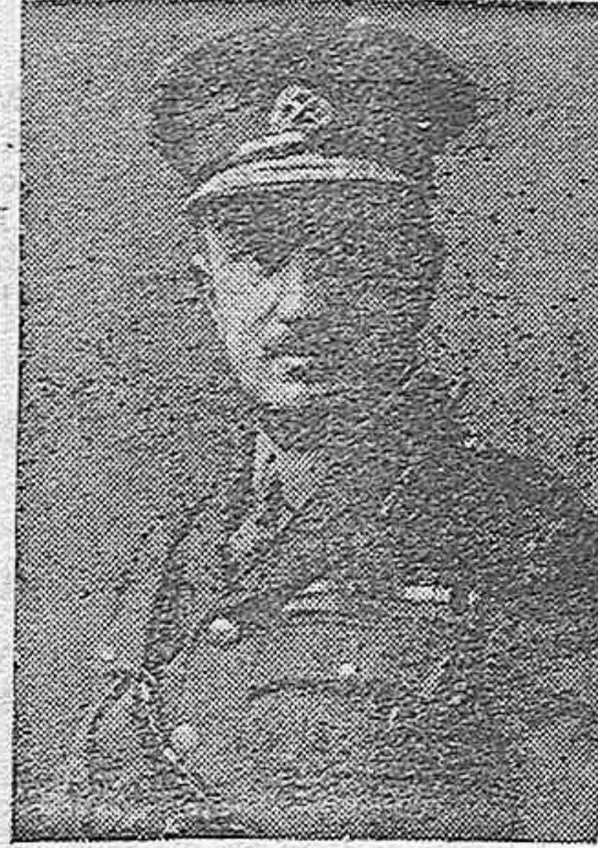
GENERAL BRIND, jefe de las tropas internacionales en el Sarre.

Ellos exigían las minas carboníferas del Sarre en calidad de «re-