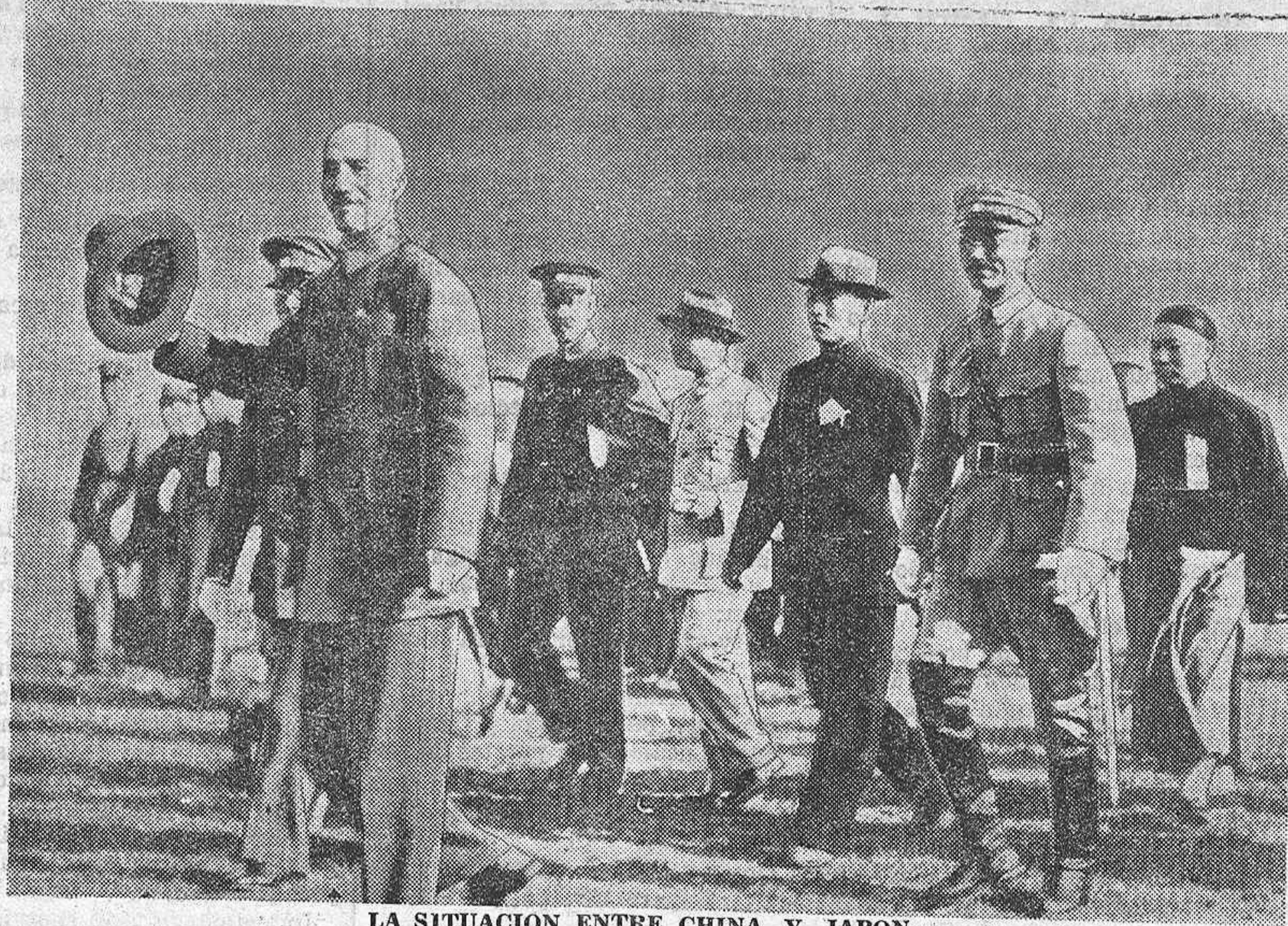
LA SITUACION ENTRE CHINA Y JAPON. El general chino Chiang Kai Shek es acompañado por entusiastas partidarios cuando se dirige a un mítin.

lén, 24: una de subteniente y otra de brigada; Batallón Montaña de Arapiles 7 (Estella): una de sargento; Artillería: 5 de subteniente, 5 de brigada y 11 de sargento. Maestros guarnicioneros, 2 en el 12 Ligero