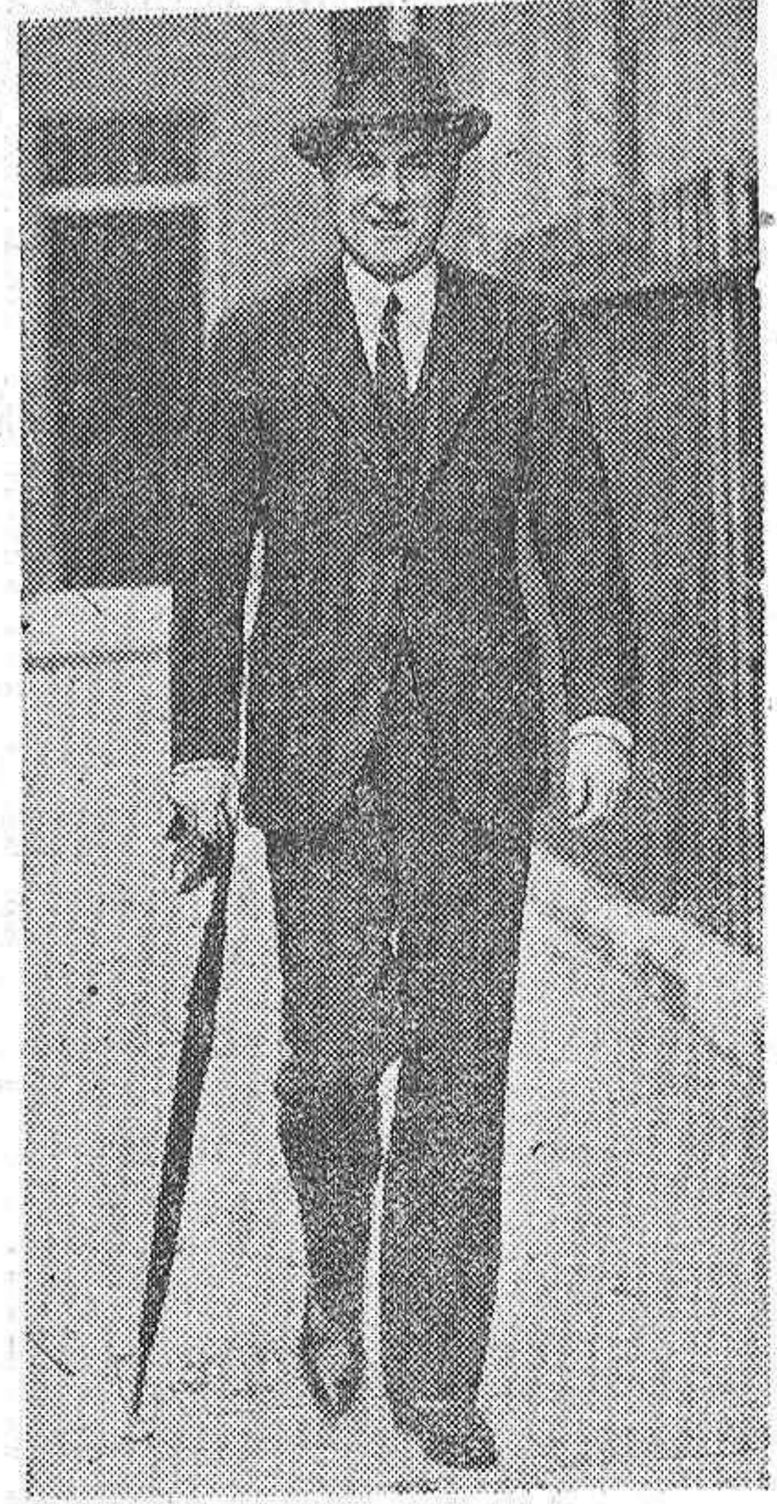
SIR SAMUEL HOARE

También desembarcaron bastantes cañones y comenzaron a realizar trabajos para emplazar las baterías.