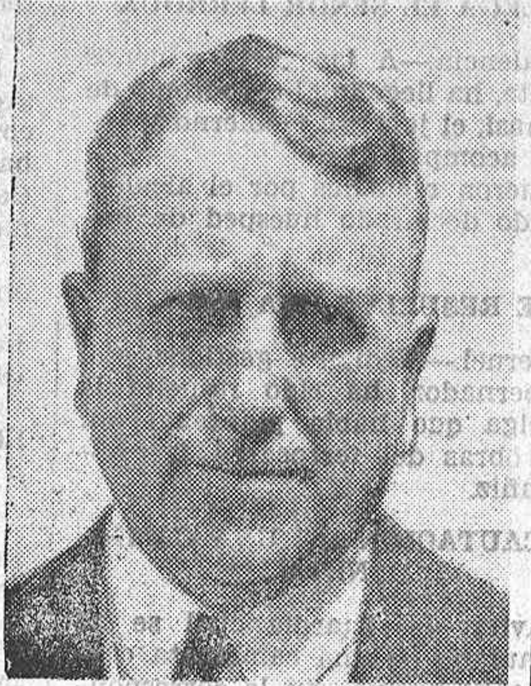
VILLIAM RANDOLPH HEARST, célebre rey de la prensa americana que por medio de su gran influencia contribuye a levantar la oposición contra el presidente Roosevelt

Guerra a la guerra, debe ser el grito de todos los hombres en estos tiempos de negruras e infortunios para el mundo.