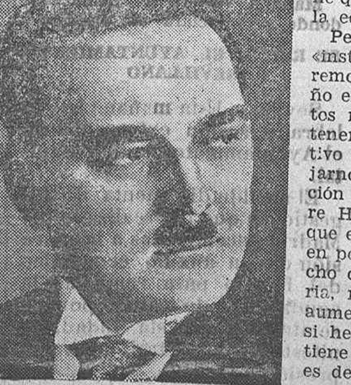
STOJADINOVITSJ, nuevo jefe de gabinete de Yugoslavia