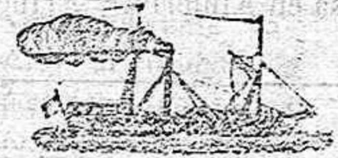
El nuevo y magnífico vapor Español TERESA.

Saldrá para ORAN todos los sábados á las 6 en punto de la tarde, admitiendo carga y pasajeros para dicho punto.