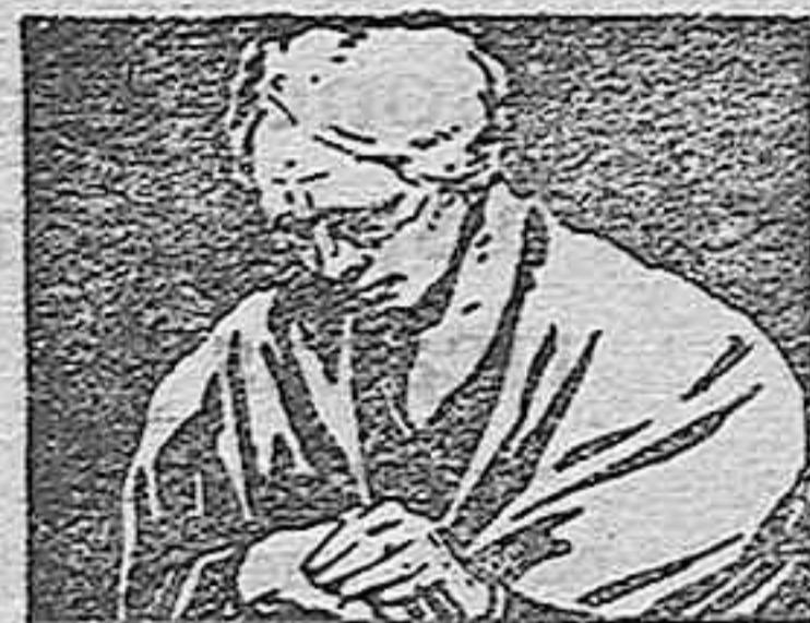
CALIENTA COMO LOS RAYOS DEL SOL