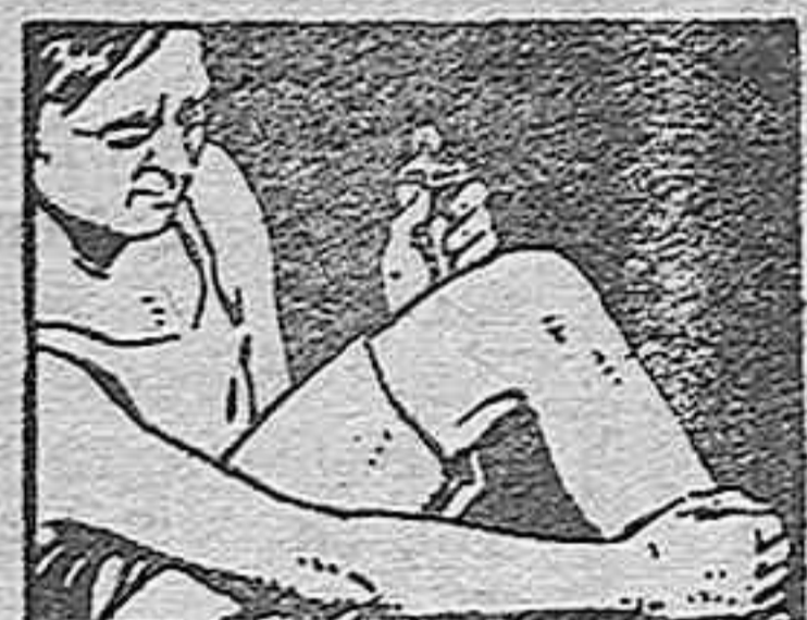
LINIMENTO DE SLOAN PENETRA SIN FROTAR