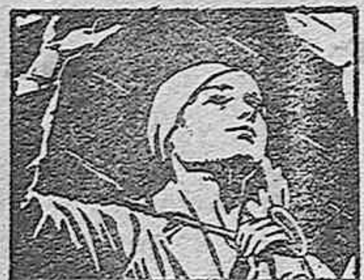
EVITA RESFRIADOS Y ENFRIAMIENTOS

Casa Central: Gabinete Ortopédico "HERNIUS" - 62, Pelayo, 62 - BARCELONA