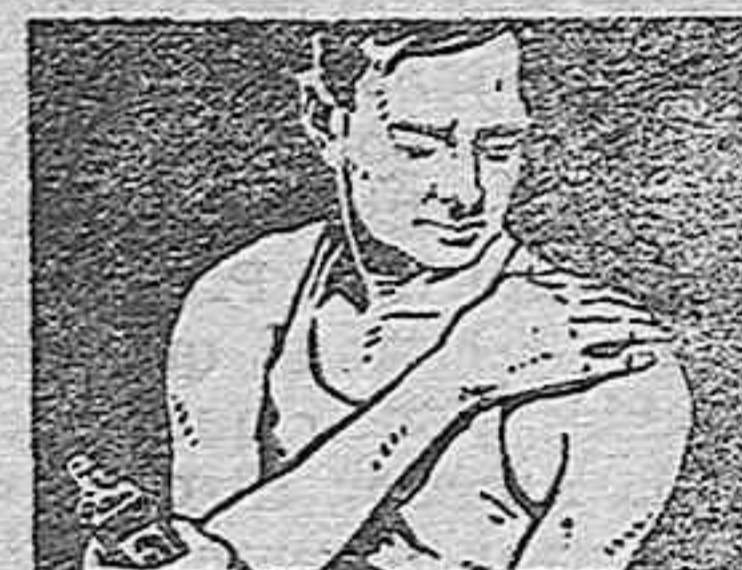
DESCONGESTIONA Y PRODUCE BIENESTAR