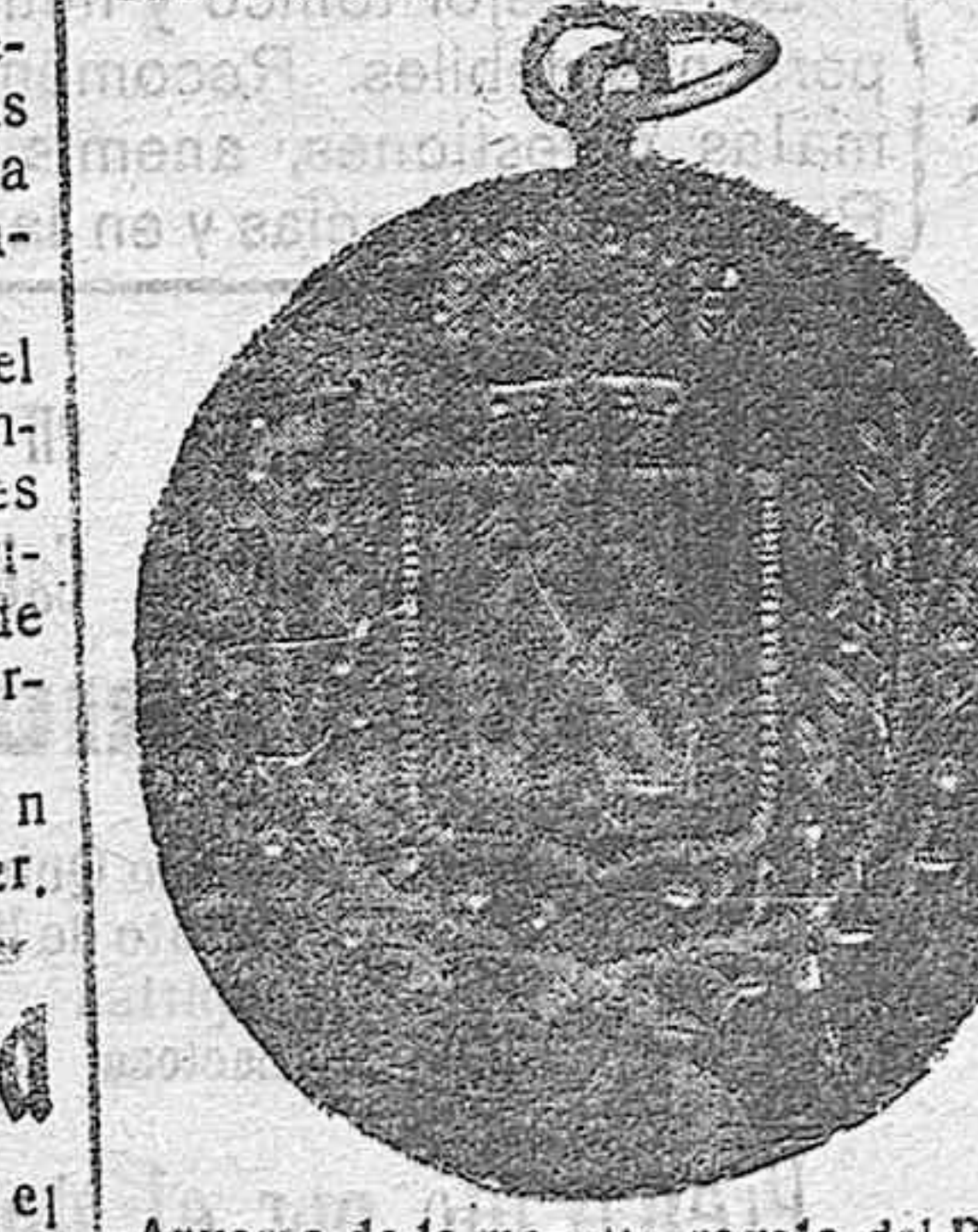
Anverso de la medalla, regalo del Regimiento de la Corona a la Junta de Damas de Almería.