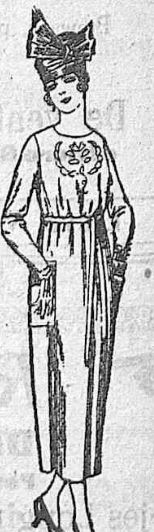
Vestidos de tricó de lana, en azul y colores, bordados a mano. a ptas. 112