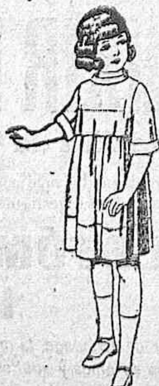
Vestidos de seda liberty, pongé, etc., para niñas de 7 a 12 años. de ptas. 30 a 38