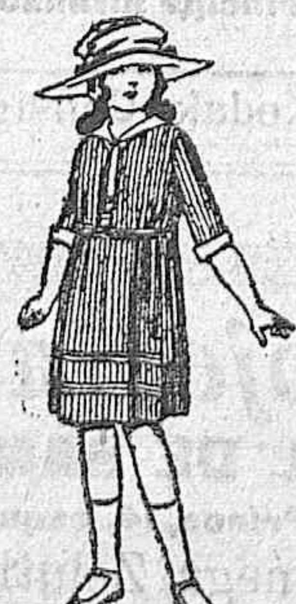
Vestidos de voile, listados, adornos blancos, para niñas de 4 a 9 años. de ptas. 22 a 38