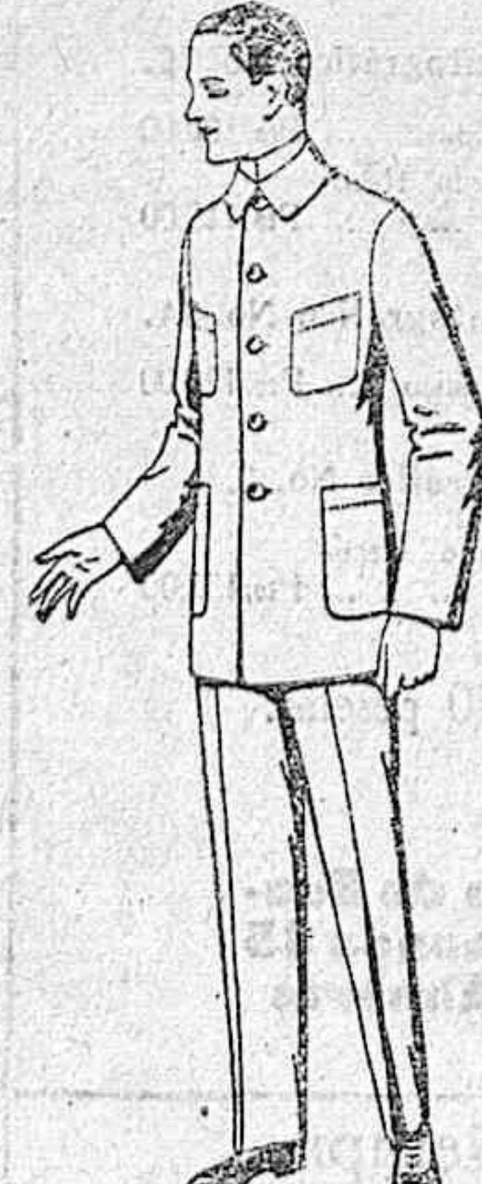
Trajes de dril azul para mecánicos. de ptas. 17 a 25.

Camisería, Géneros de punto, Corbatería, Guantería, Sombrerería, Zapatería, Paraguas, Bastones y Artículos de Viaje