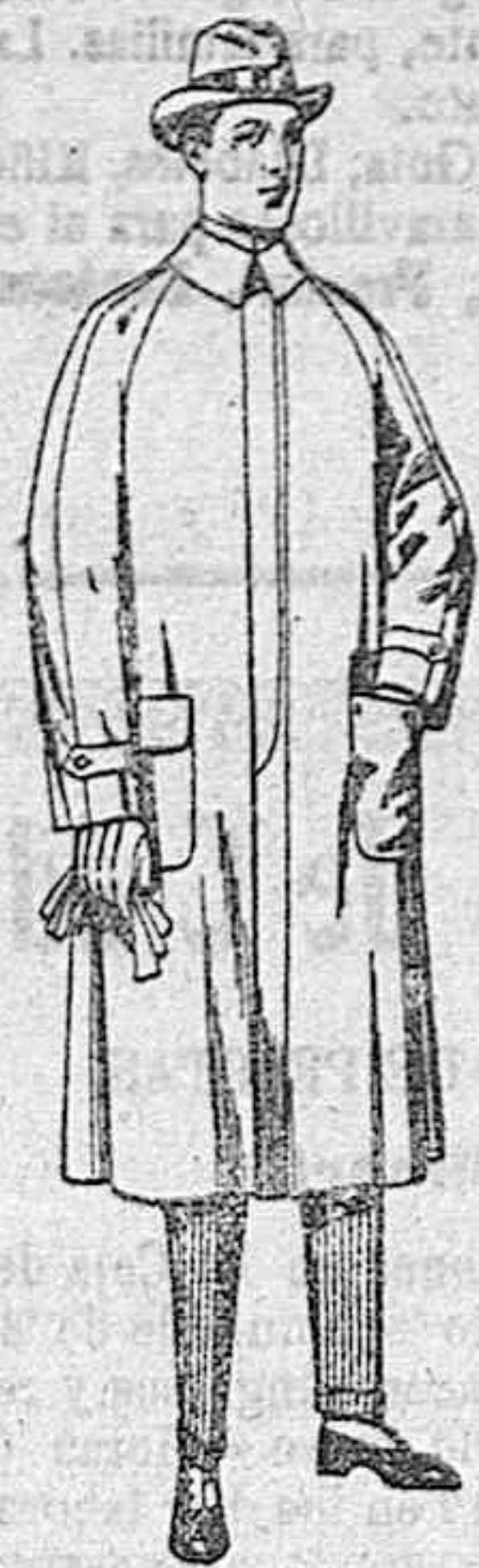
Impermeables, forma gabán, «Raglan» de ptas. 40 a 160

SUCURSALES: Madrid, Barcelona, Alicante, Bilbao, Cádiz, Cartagena, Gijón, Granada, Málaga, Palma de Mallorca, Santander, Sevilla, Valencia, Valladolid y Zaragoza