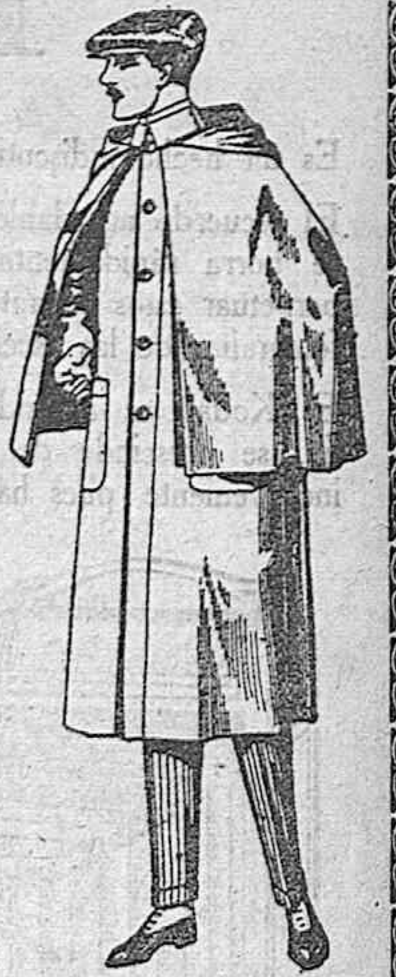
Impermeables forma «Mackferland», en negro y azul de ptas. 65 a 128