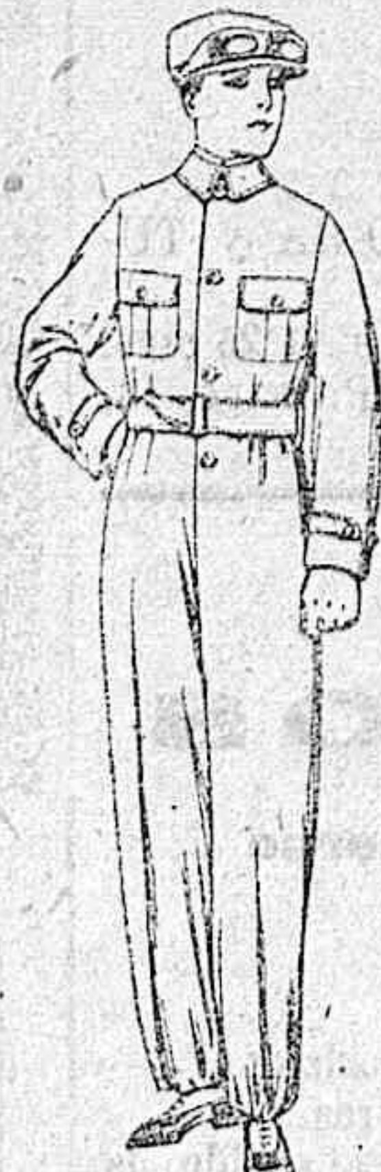
Trajes de dril azul, beige, kaki, etc., para aviador, motociclista, mecánico, etc. de ptas. 18 a 25