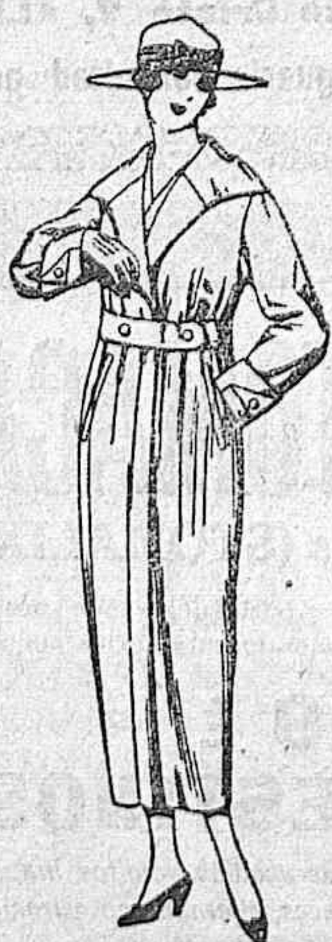
Guardapolvos de gabardina, dril y alpaca, colores beige, kaki, gris, etc. de ptas. 22 a 55

Camisería, Géneros de punto, Corbatería, Guantería, Sombrerería, Zapatería, Paraguas, Bastones y Artículos de Viaje