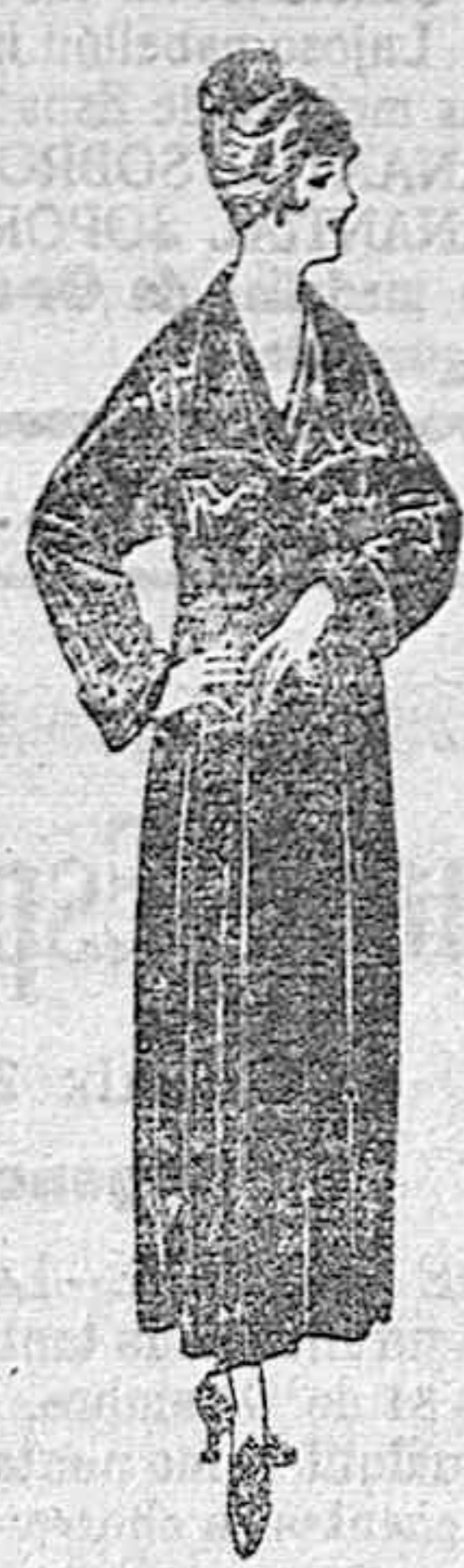
Batas de crespón, esterilla, etc. de ptas. 32 a 46