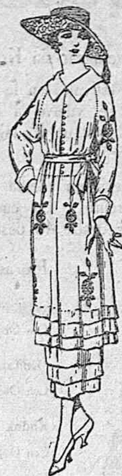
Vestidos de etamin blanco, azul y color, adornos bordados de ptas. 50 a 68