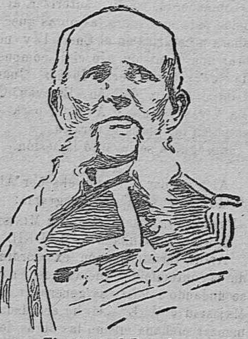
El general Puente

Sin embargo, el asunto no ha perdido más que en una pequeña parte su gravedad; pues si delictivo en alto grado es el hecho de que un general estampe en el papel y haga públicas frases y conceptos contrarios á la disciplina, por entranar censuras y faltas de respeto á un superior, no lo es menos que á aquél se le atribuya semejante proceder por medio de un escrito apócrifo.