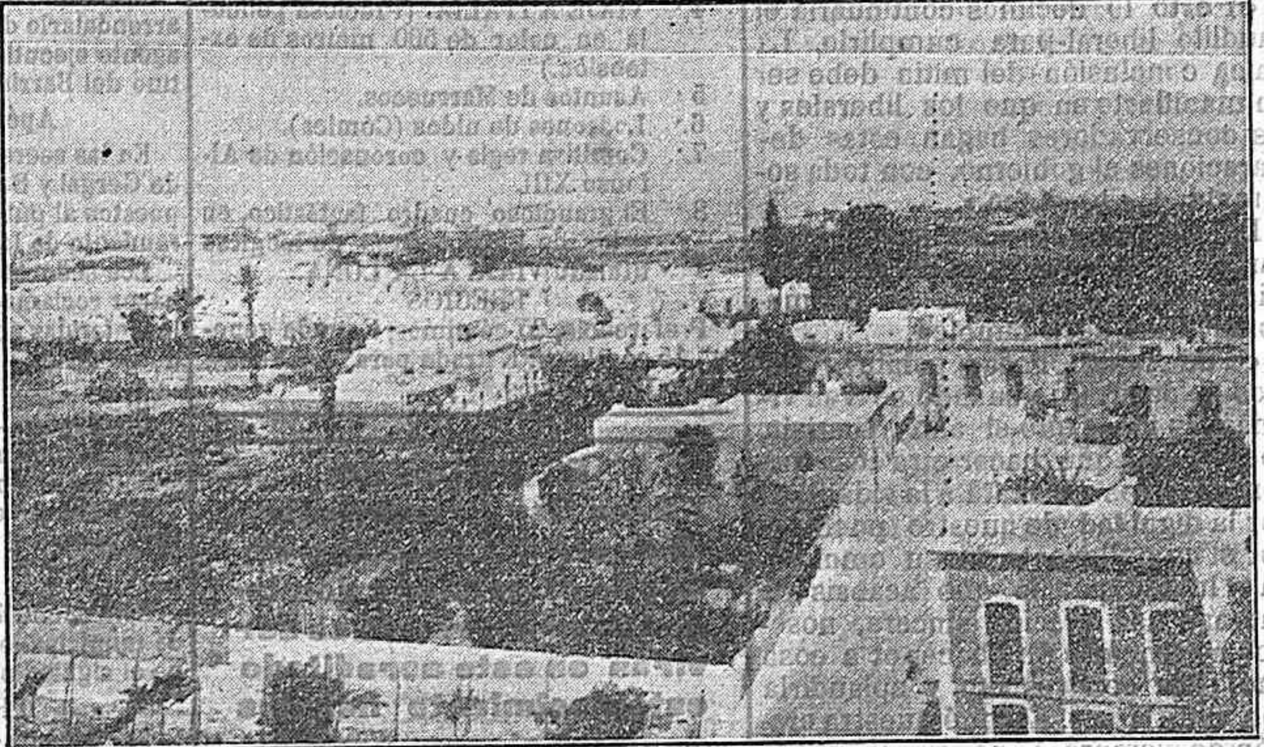
Vista del pueblo.