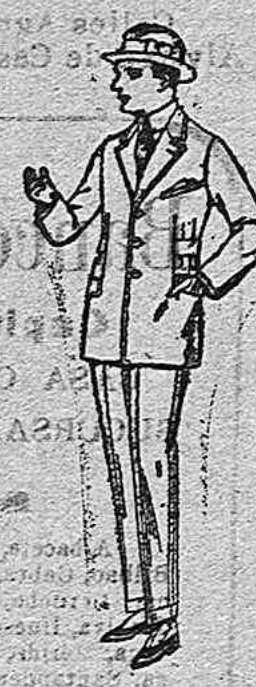
Trajes pátón, vicuña o jerga, forma sport para niños y jovencitos de 10 a 16 años. de ptas. 20 a 85.