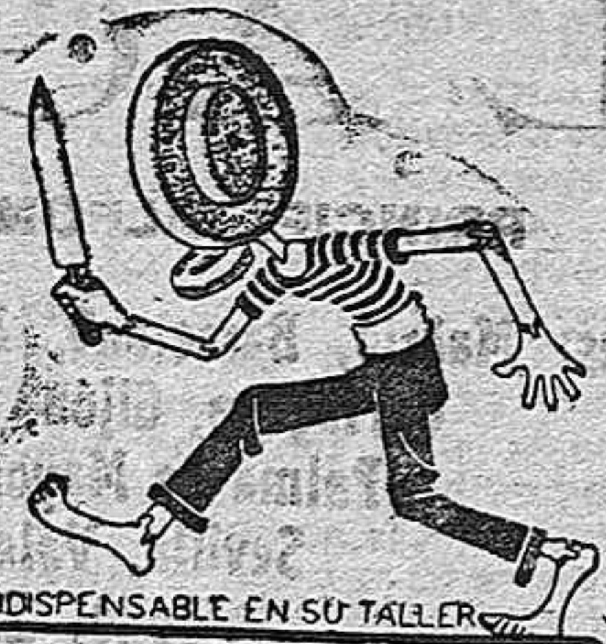
INDISPENSABLE EN SU TALLER

Piedra natural clasificada, indispensable en su taller. Única piedra que tiene aplicación en todas las industrias, merced a su CLASIFICACIÓN.