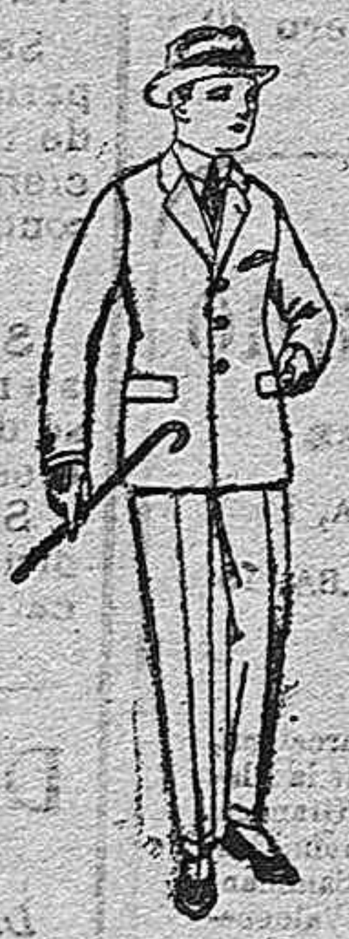
Trajes de pátón, vicuña o jerga, para niños y jovencitos de 10 a 16 años. de ptas. 30 a 85