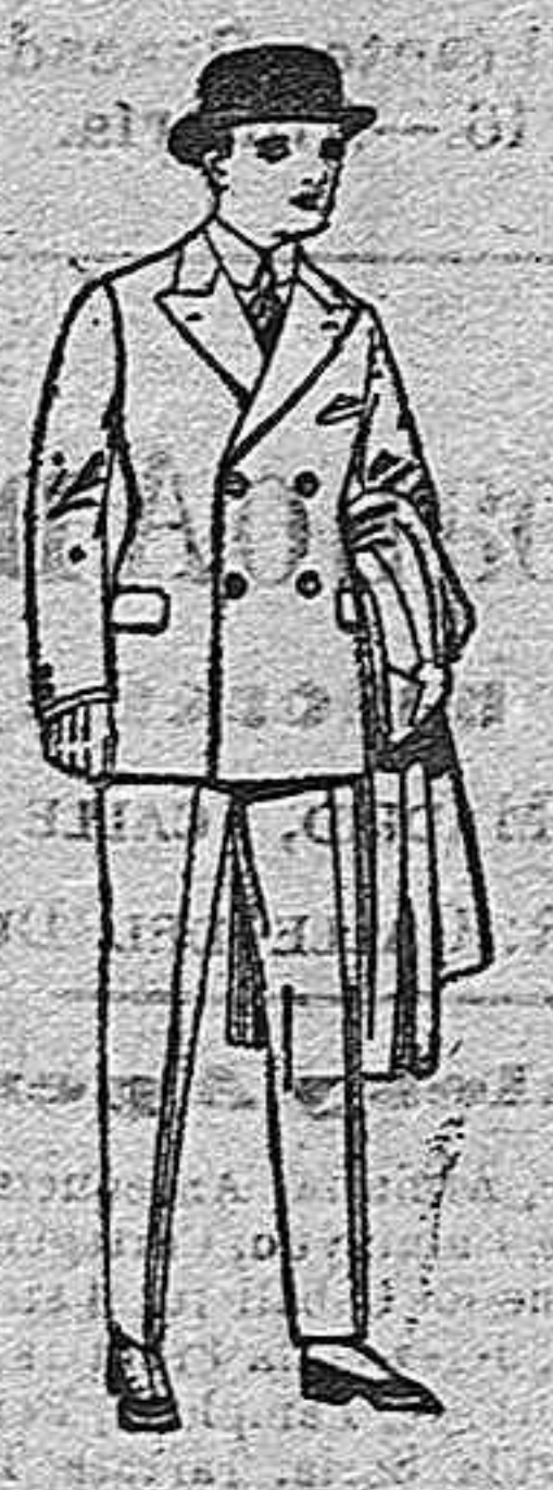
Trajes de pátón, vicuña, etc., para niños y jovencitos de 10 a 16 años. de ptas. 30 a 85.