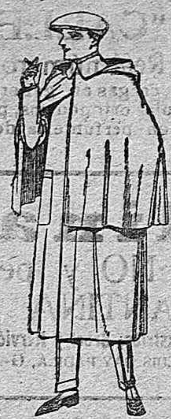
Impermeables mackferland en negro y azul de ptas. 85 a 175