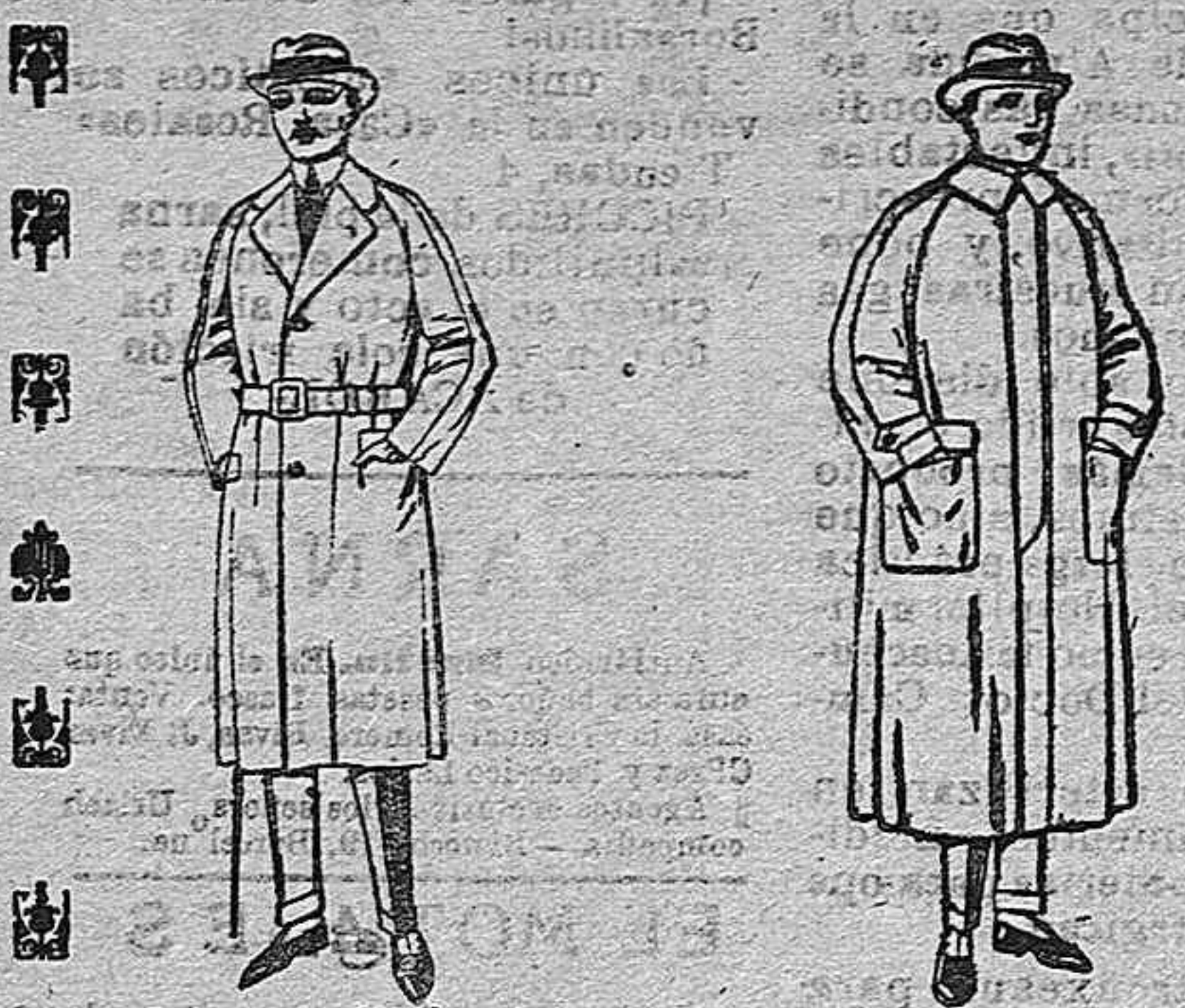
Gabanes raglán de pátón, gamuzas o cover de ptas. 28 a 160

Sucursales: Madrid, Barcelona, Alicante, Bilbao, Cádiz, Cartagena, Gijón, Granada, Málaga, Palma de Mayorca, Santander, Sevilla, Valencia, Valladolid, Zaragoza.