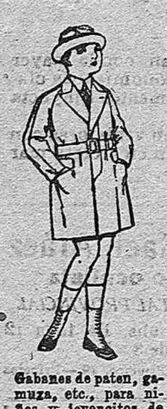
Gabanes de pátón, gamuzas, etc., para niños y jovencitos de 10 a 16 años de ptas. 88 a 85