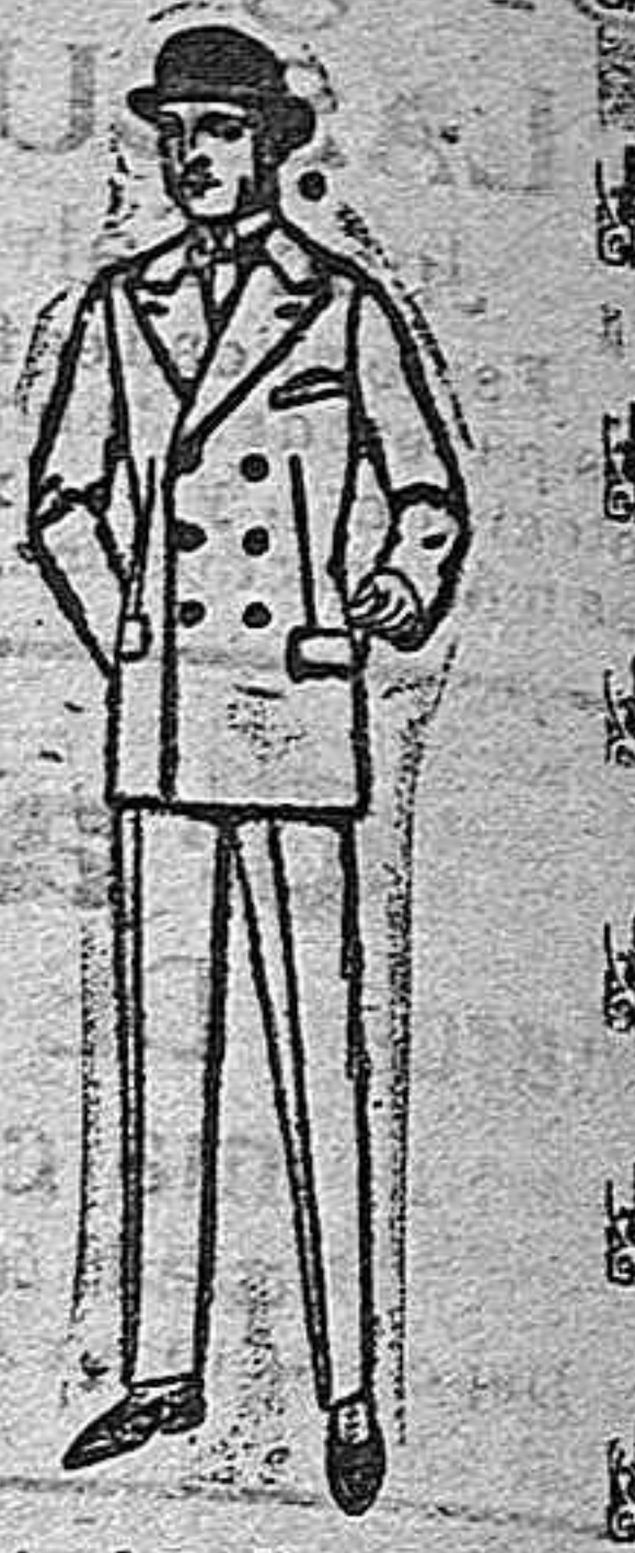
Trajes de melton cheviot, estambre, vicuña o jerga de ptas. 38 a 150