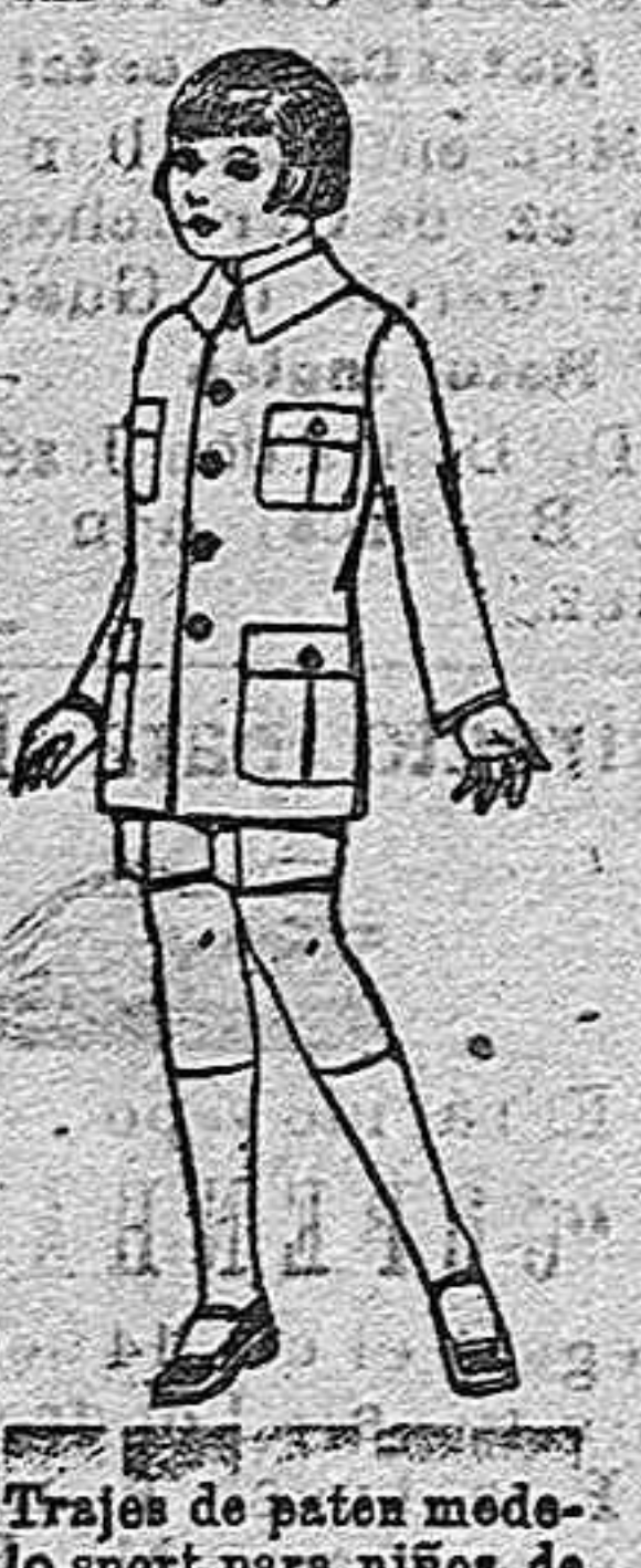
Trajes de pátón modelo sport para niños de 4 a 9 años de ptas. 16 a 70