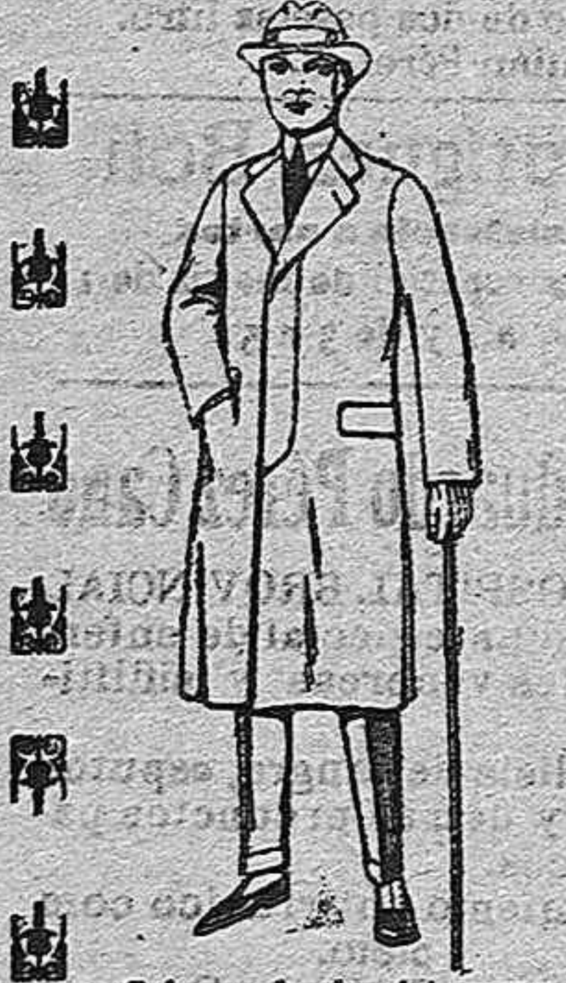
Gabanes de cheviot, gamuzas o pátón etc. de ptas. 48 a 140