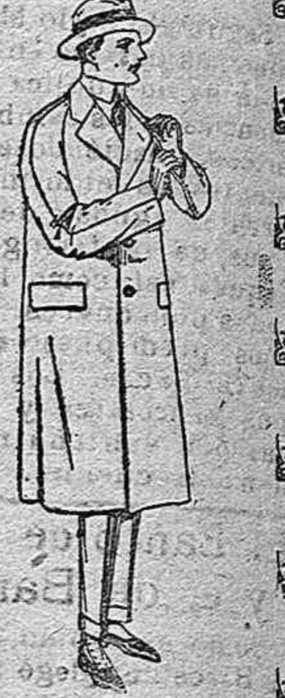
Gabanes raglán de pátón, melton o cheviot, con forro asá o satén de ptas. 60 a 160