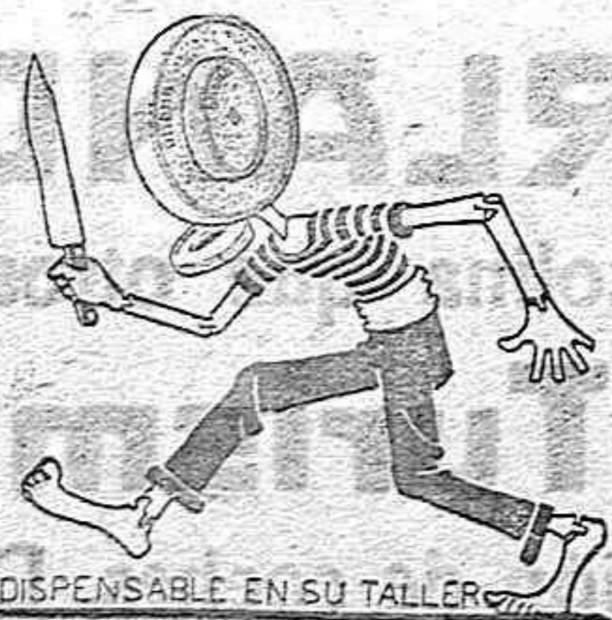
INDISPENSABLE EN SU TALLER

Depositorio exclusivo de la gran Fabrica de piedras de afilar y demás aplicaciones marca ONENA, de Santander