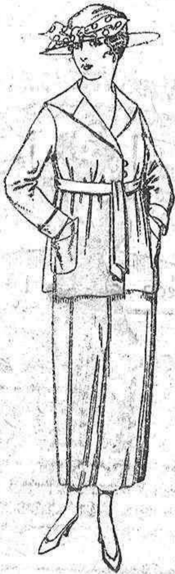
Patelots de punto de seda, en negro, azul y color. De ptas. 33 a 90.

Ropas confeccionadas para Caballero, Señora, Niño y Niña