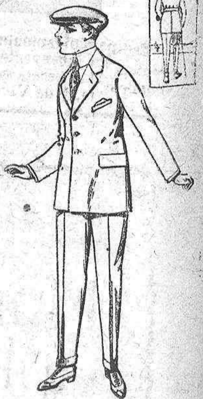
Trajes modelo sport, de lanilla meltón, para jovencitos de 10 a 16 años. De ptas. 23 a 58.

LUNA DEL POLO MEDIO SIGLO DE EXITO. ESPARDES. NO DEJARSE SORPRENDER POR DENTIFICOS EXTRANJEROS.