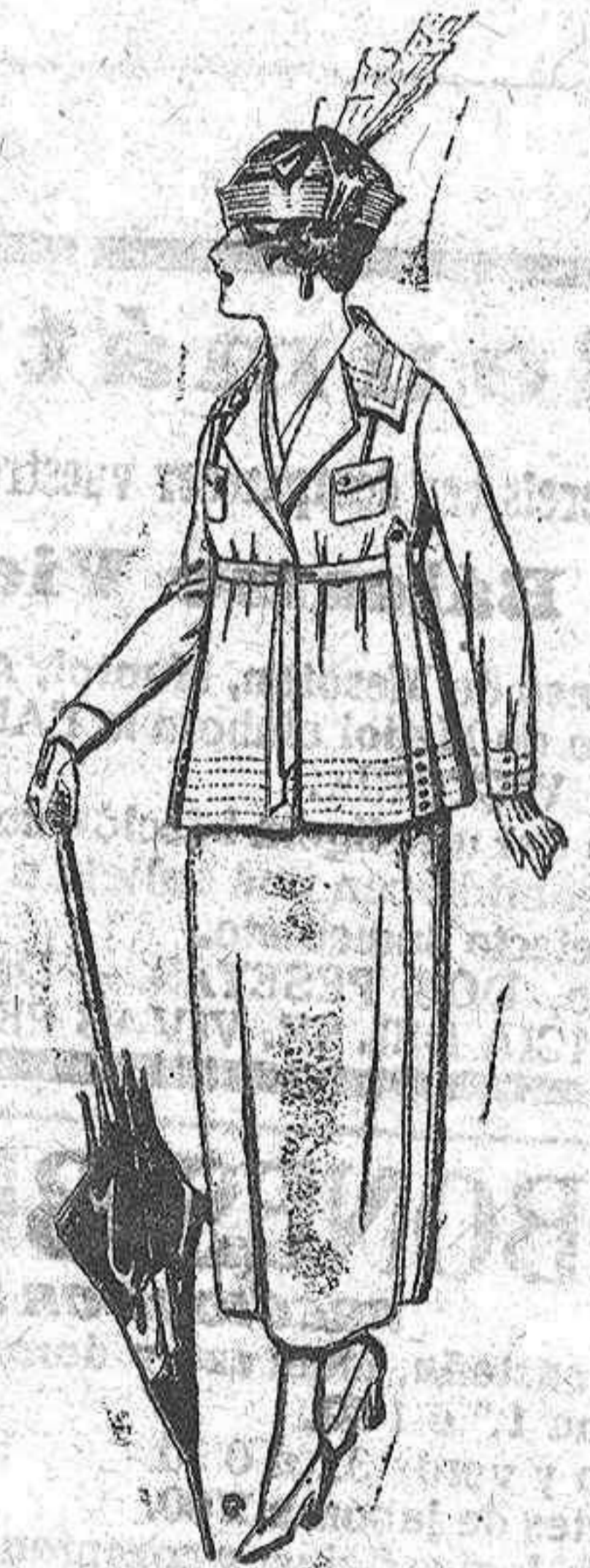
Trajes de gabardina, estam- bre, lanilla, ect., en negro, azul y color, adornos bor- dados. De ptas. 77 a 85.

Camisería, Géneros de punto, Cor- batería, Guantería, Sombrerería, Zapatería, Paraguas, Bastones y Artículos de Viaje.