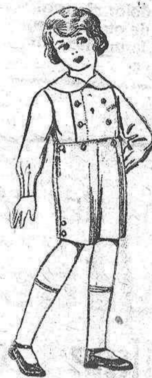
Trajes de vicuña o estambre azul, para niños de 3 a 7 años. De ptas. 6 a 13.