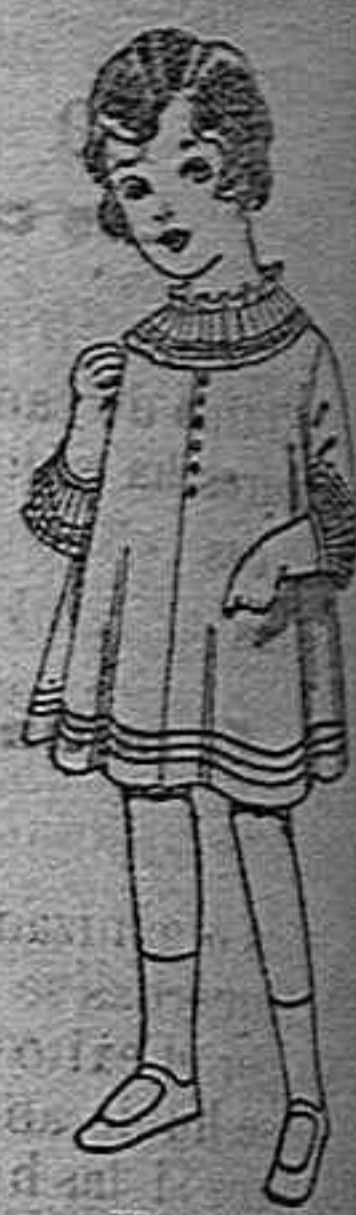
Vestidos de lana blanca para niñas de 4 a 9 años. De pesetas 6 a 14.