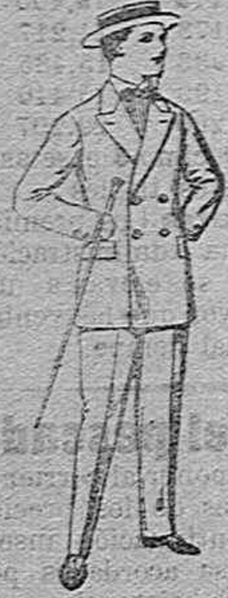
Traje de estambre, vienna o je-ga, para jovencito de 10 a 17 años. De pesetas 19 a 50.