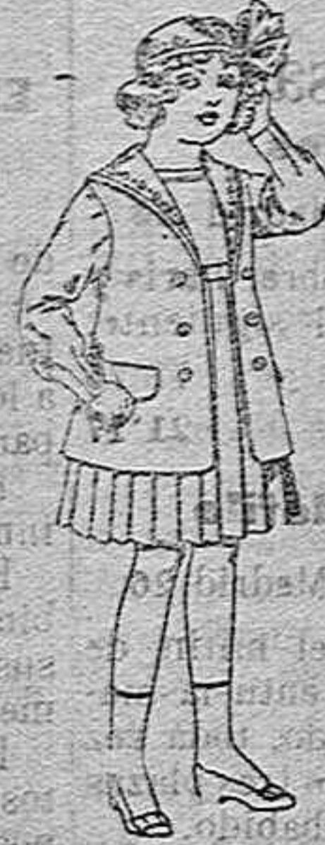
Traje de g-bardina blanco, cuello de orandín bordado, para niñas de 4 a 9 años. De pesetas 22 a 24.