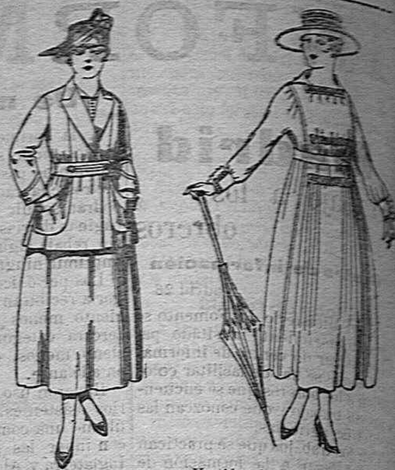
Traje de estambre negro, azul y color de pesetas. 70 a 70. Vestidos de lanilla negra, azul y color de pesetas. 60 a 70.