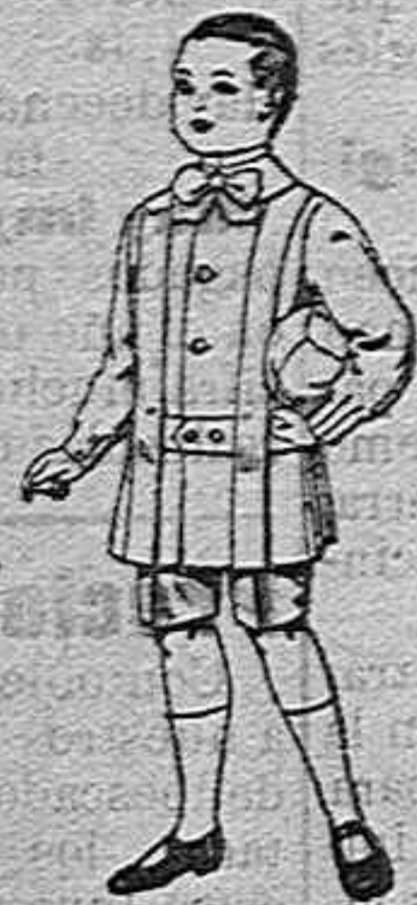
Trajes de lanilla para niños de 4 a 9 años. De pesetas 12 a 31.