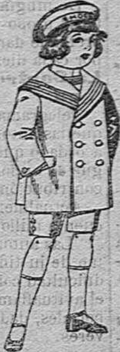
Trajes matelot de vicuña o jorral azul para niño de 4 a 9 años de 14 pesetas a 32.