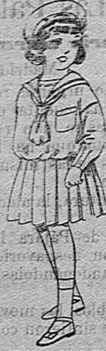
Trajes de marino de lanilla azul para niñas de 4 a 9 años de pesetas 32 a 33 los mismos de dril blanco de 18 a 24 pesetas.