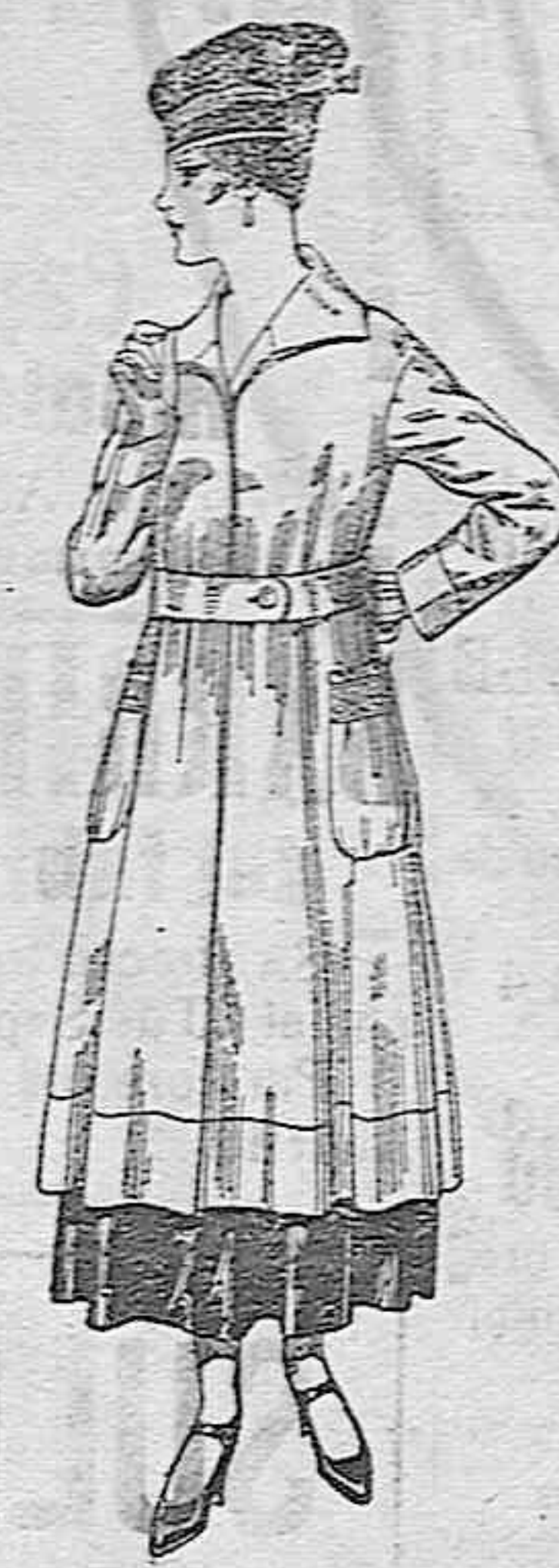
Abrigos de tricot de lana, en colores lisos, de pesetas 63 a 75.