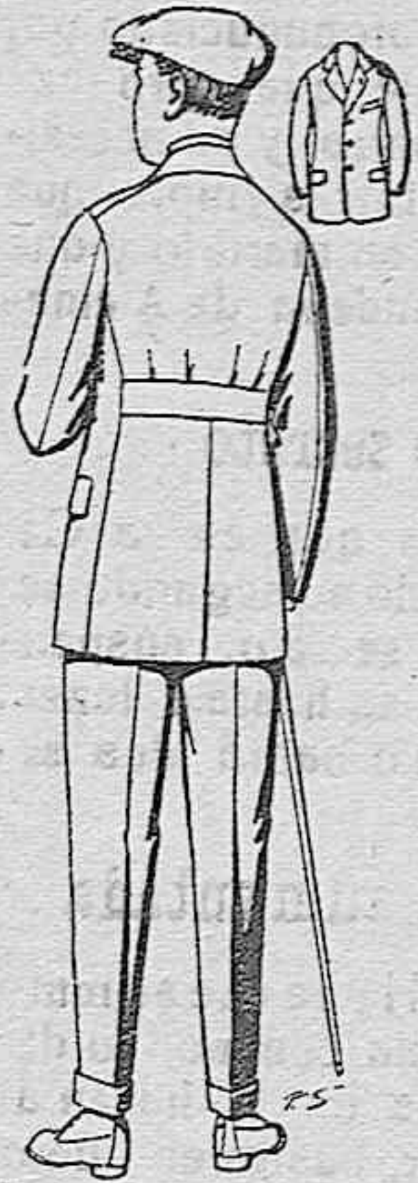
Trajes modelo sport, de lanilla, mellón, etc. para jovencitos de 10 a 15 años, de ptas. 27 a 52. Los mismos en dril de ptas. 11 a 21.