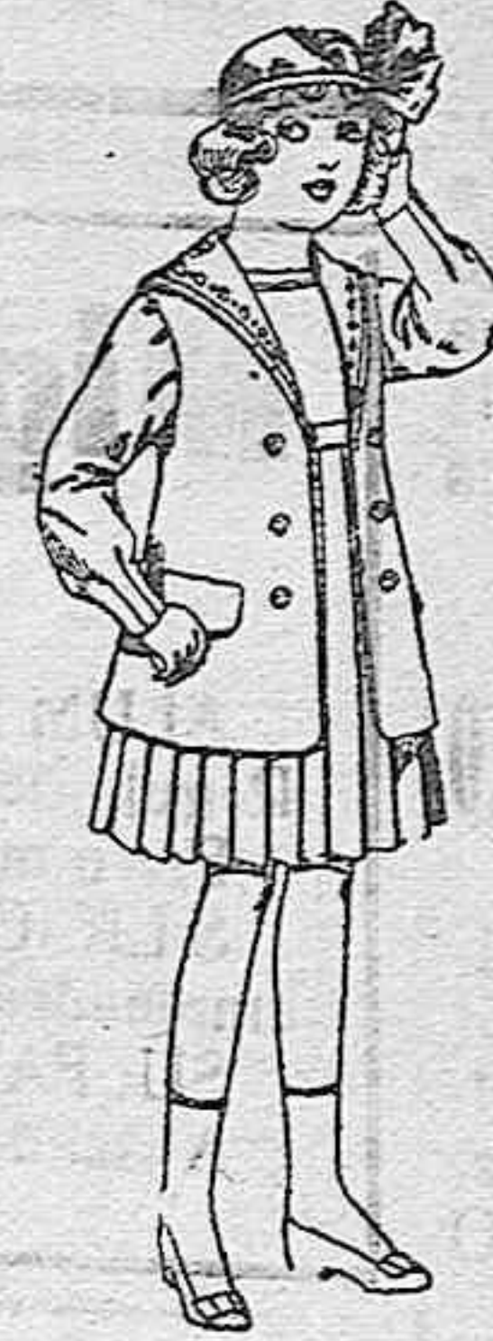
Trajes de gabardina blanco, cuello de organdín bordado, para niñas de 4 a 9 años, de ptas. 22 a 24