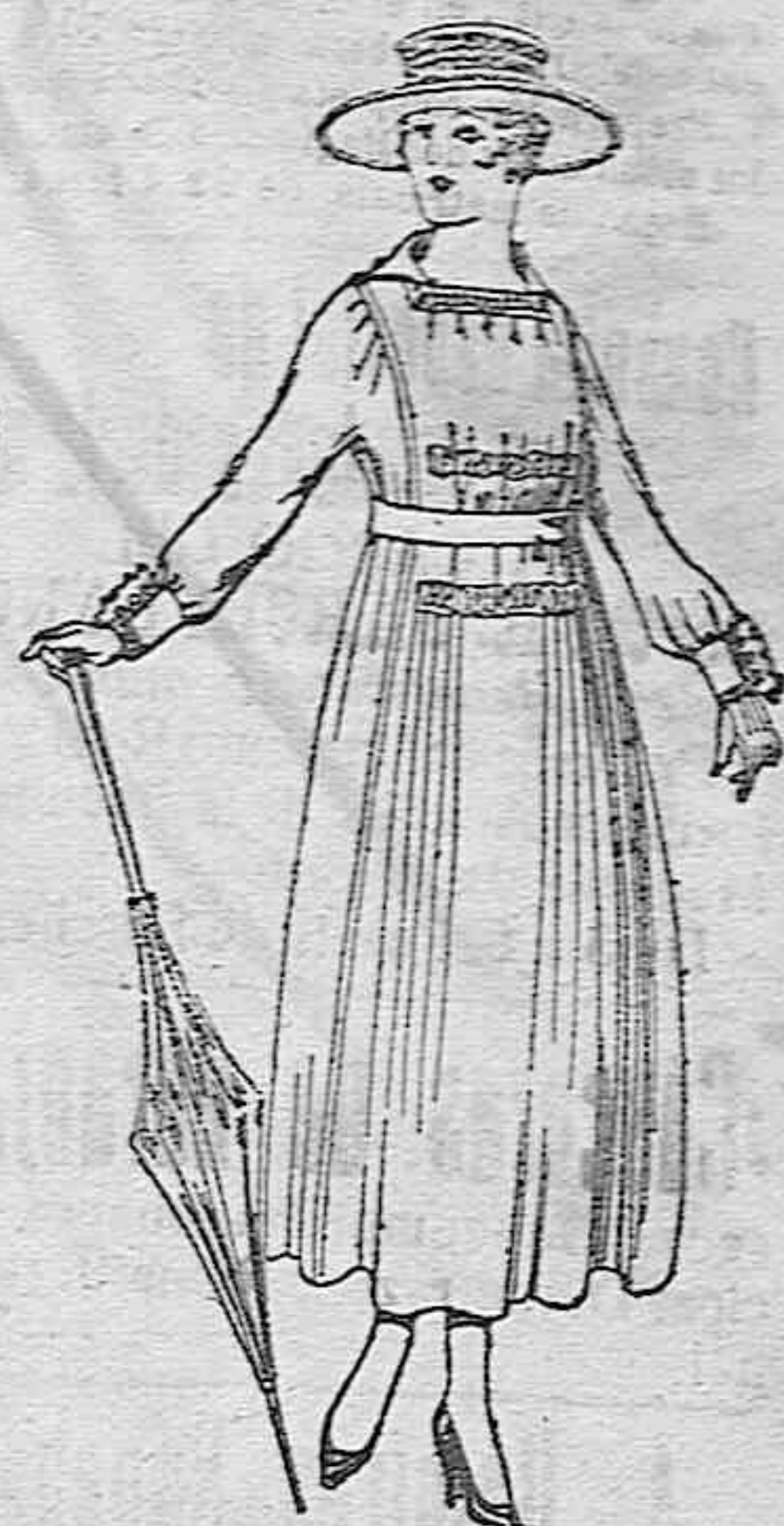
Vestidos de lanitas negras, azules y colores, de pesetas 60 a 70.