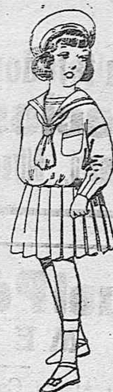
Trajes de marinera de lanilla azul para niñas de 4 a 9 años de ptas. 32 a 38. Los mismos de dril blanco de 18 a 24 ptas.