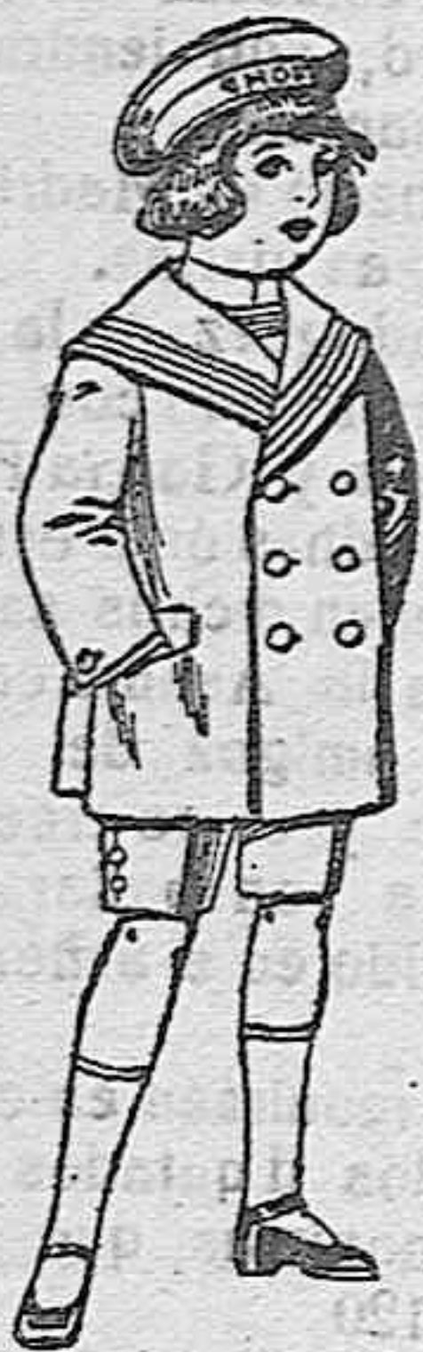
Trajes matlot de vienna o jergal azul para niño de 4 a 9 años de ptas. 14 a 32