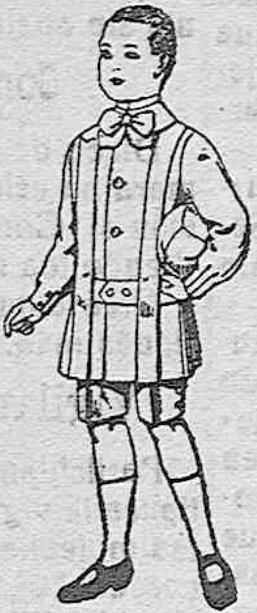
Trajes de lanilla para niños de 4 a 9 años de ptas. 12 a 31.