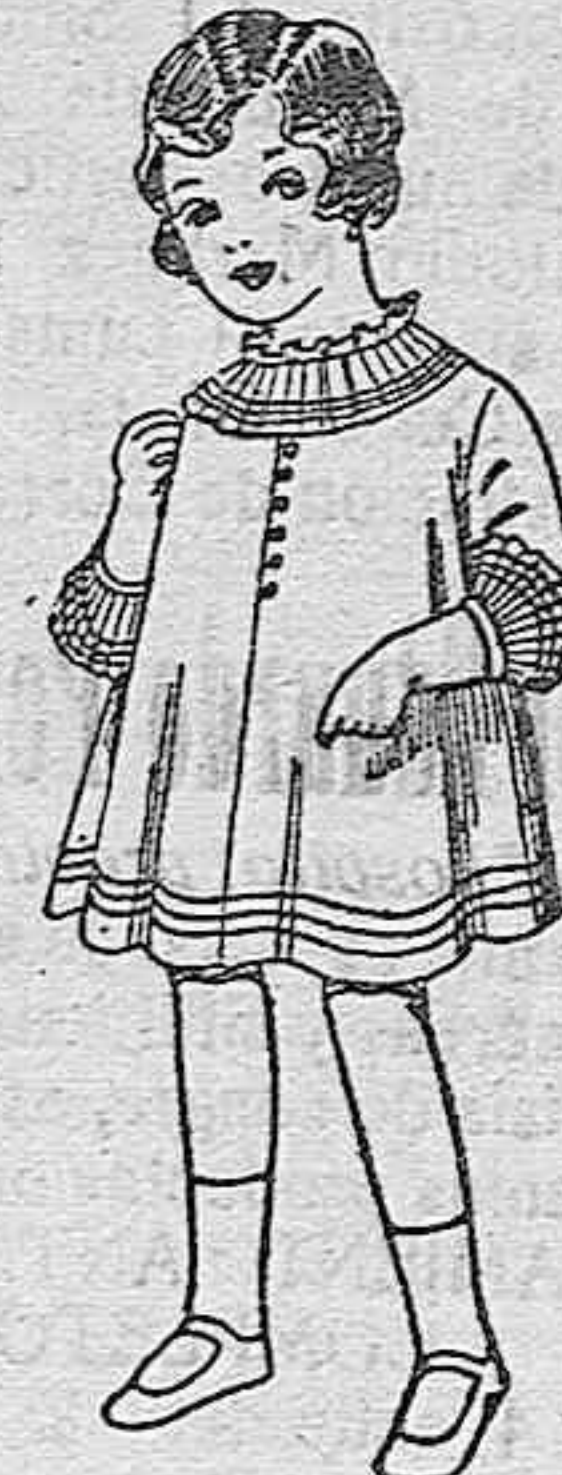
Vestidos de seda blanco bordados, de pesetas. 6'75 a 8.