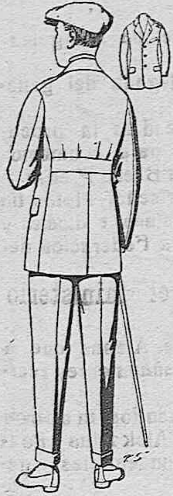
Trajes modelo sport, de lanilla, mellón, etc., para jovencitos de 10 a 15 años, de ptas. 27 a 52. Los mismos en dril de ptas. 11 a 21.