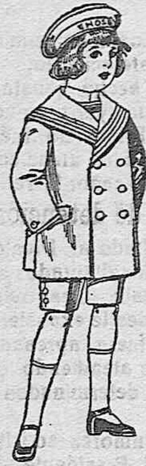
Trajes matotot de vicuña o jergal azul para niño de 4 a 9 años de ptas. 14 a 32

Géneros del país y extranjeros para la Sección de medida.