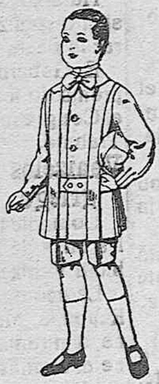
Trajes de lanilla para niños de 4 a 9 años de ptas. 12 a 31.