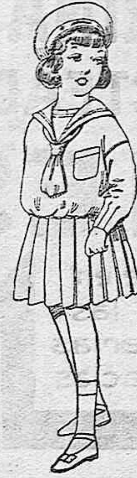
Trajes de marinera de lanilla azul para niñas de 4 a 9 años de ptas. 32 a 38. Los mismos de dril blanco de 13 a 24 ptas.