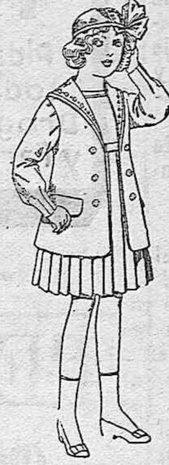
Trajes de gabardina blanco, cuello de organdín bordado, para niñas de 4 a 9 años, de ptas. 22 a 24