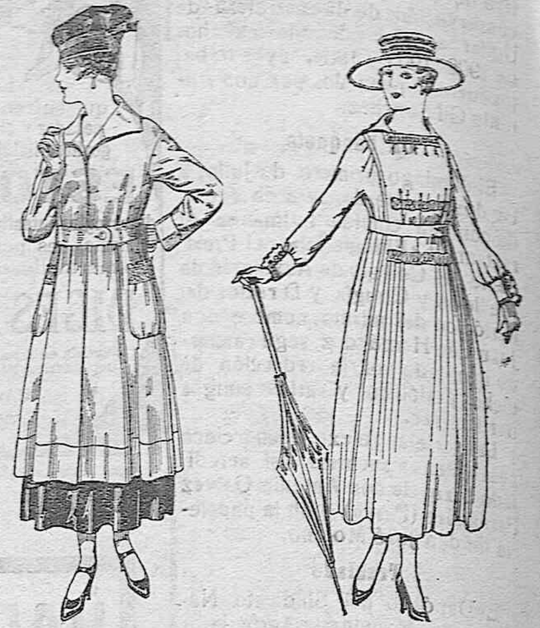
Abrigos de tricot de lana, en colores lisos, de pesetas 63 a 75.