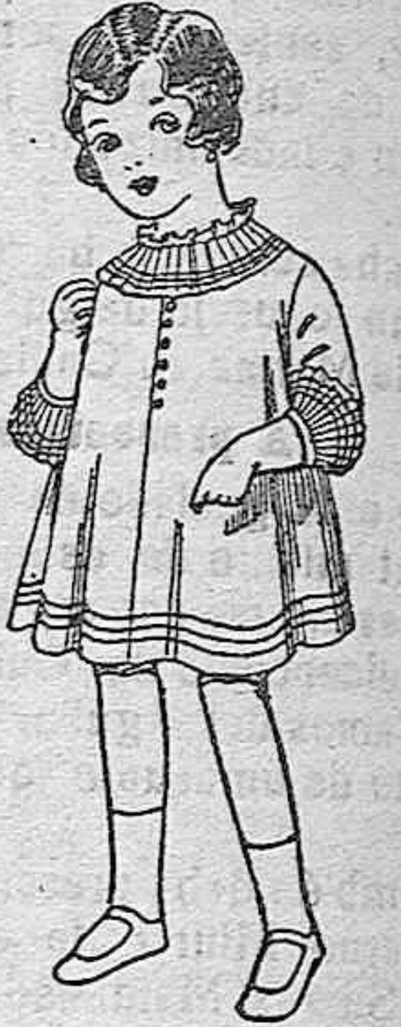
Vestidos de seda blanco bordados. de pesetas 6'75 a 8.