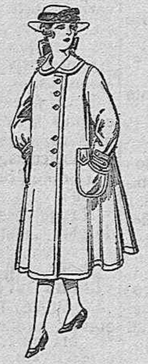
Abrigos de lana para jovencitas de 11 a 15 años, de ptas. 35 a 40