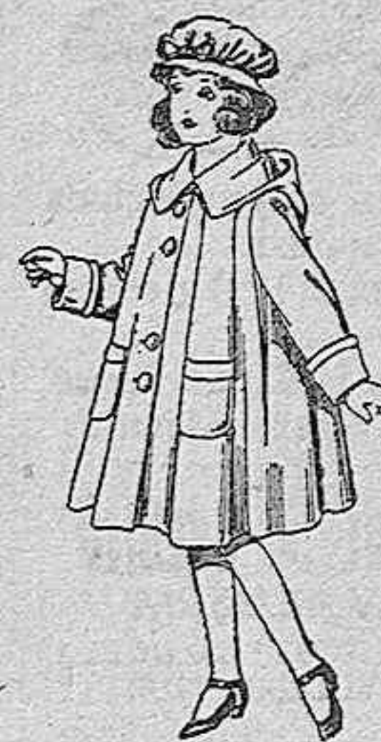
Abrigos de paten, para niñas de 4 a 9 años, de pesetas 22 a 33