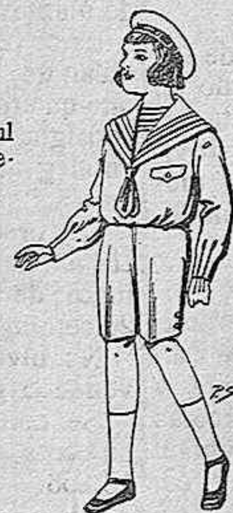
Trajes de gerga azul, Gabanes de lana vigonia o milton, para niños de 4 a nueve años, de ptas 9 a 22 años de 10 a 12 años, de pesetas 20 a 53