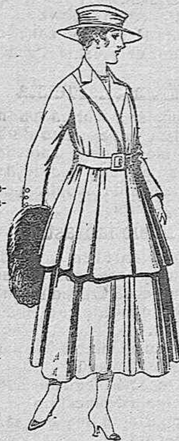
Traje de lana, para señora, en color negro y azul, de pesetas 85 a 100