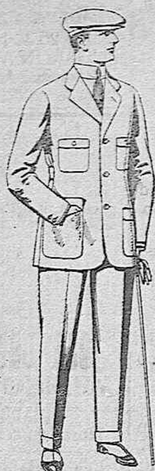
Trajes de cheviot, corte elegante, para sporman, de pesetas 45 a 55.