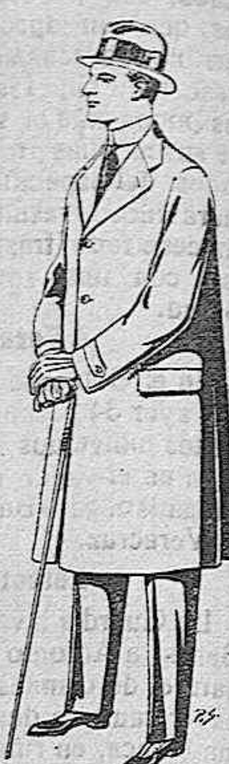
Gabanes de tejido pinma o ratina, de pesetas 33 a 110.