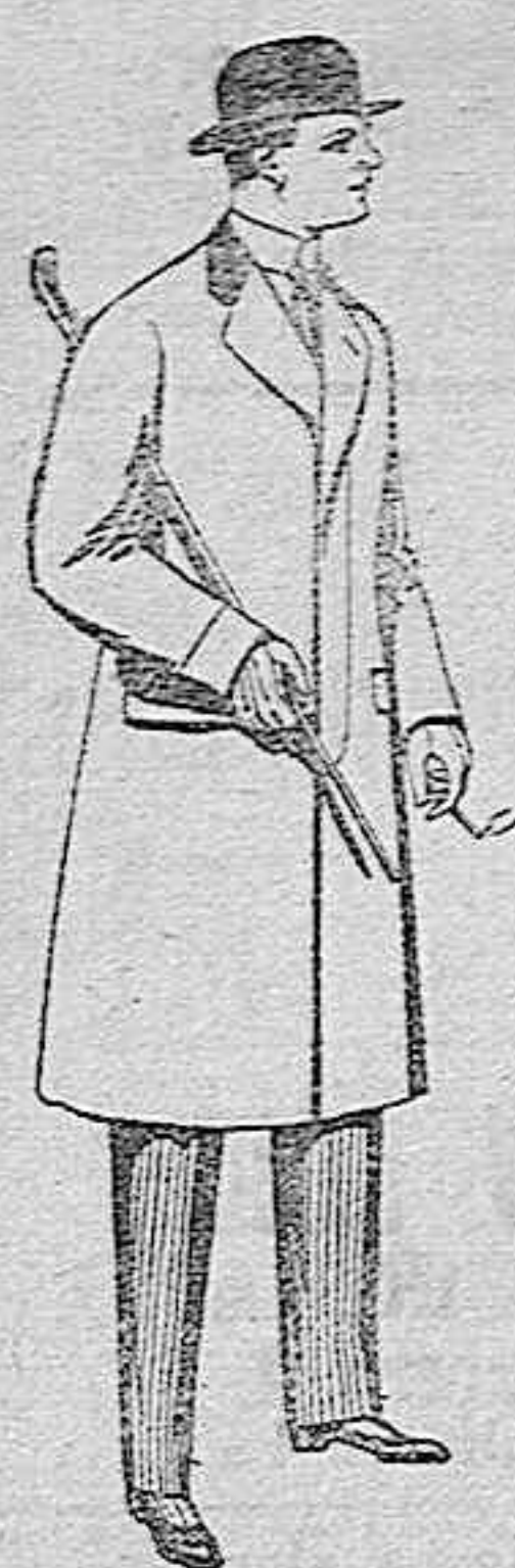
Gabanes de paten. melton y cheviot, con forros de seda. saten o escocés, de pesetas 88 a 100.