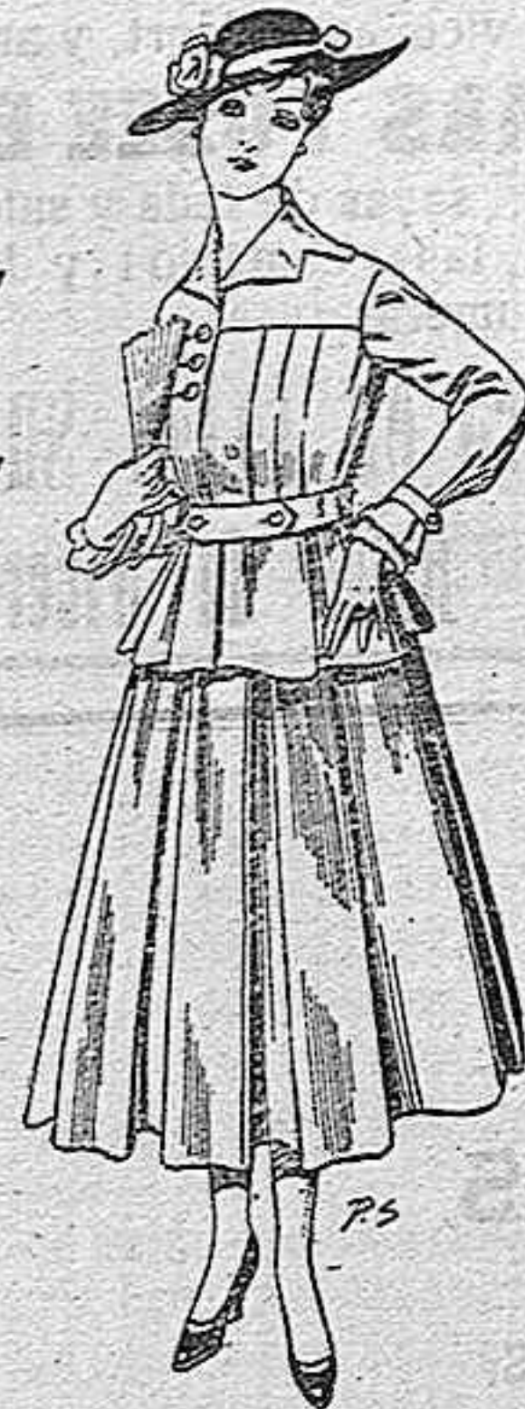
Trajes de lanilla negra, azul y color para señora A pesetas 105