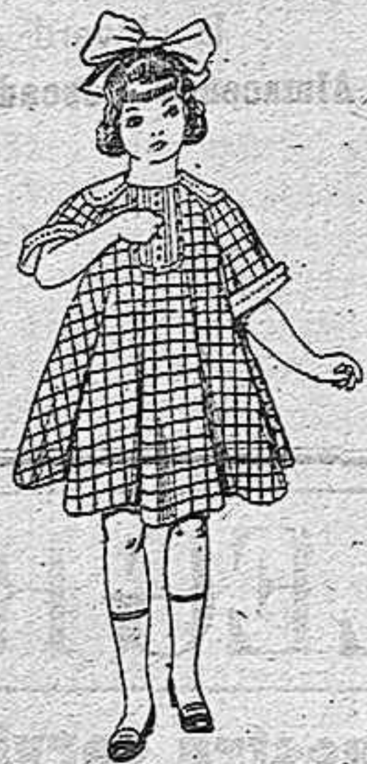
Vestidos de lanilla para niñas de 4 a 9 años. De pesetas 15 a 25