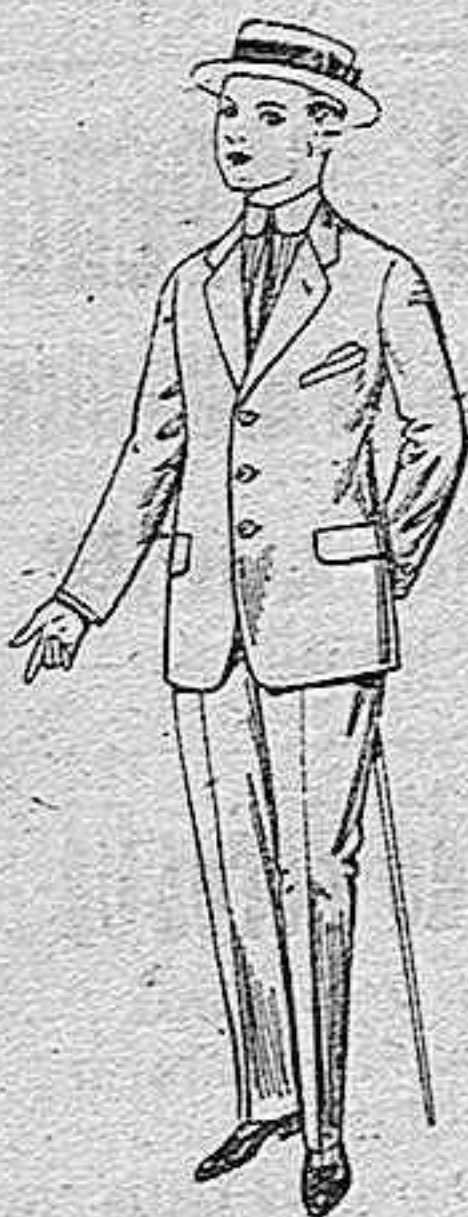
Trajes de lanilla vi-cuña etc. para juven-cios de 10 a 16 años De pesetas 14 a 48