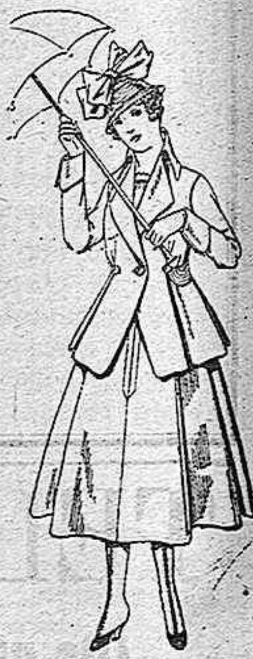
Trajes de lanilla negra, azul y color para juven-tas de 13 a 16 años De pesetas 50 a 55