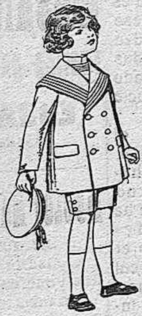
Trajes modelo mate-lot, de vicuña azul para niños de 4 a 9 años De pesetas 12 a 31