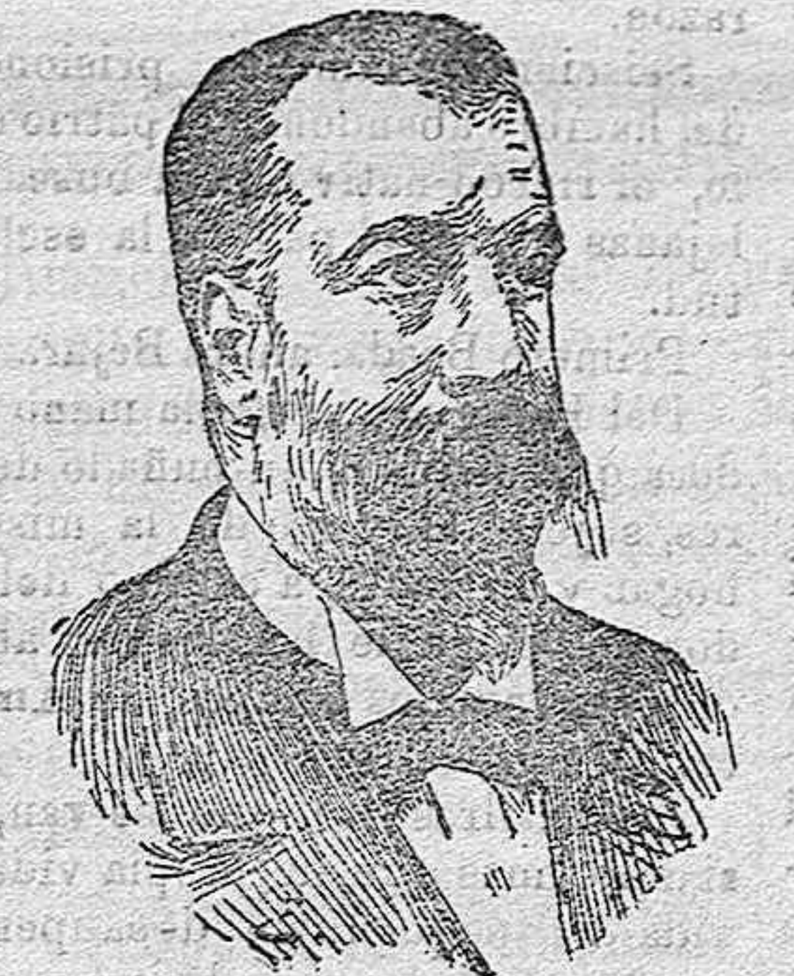
D. MARCELINO MENENDEZ PELAYO.

Reconocido esto y tratándose de la presidencia de una corporación cuyo fin es acoger en su seno á los más eminentes cultivadores de las Letras patrias, la elección no es dudosa entre esos dos grandes talentos. Tratarase de la Academia de Ciencias Morales y Políticas, y la